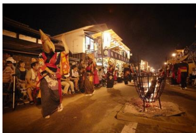
西馬音内盆踊り（羽後町）

毎年8月3日から6日に行われ、稲穂に見立てた竿燈を操りながら、力と技を競います。東北三大祭り一つです。