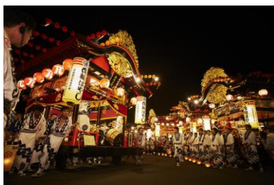
花輪祭の屋台行事（鹿角市） （花輪ばやし）

毎年8月19日・20日に行われ、日本三大ばやしにも数えられる祭りばやしと、豪華な屋台のエネルギーなお祭りです。