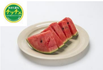
あきた夏丸チッチェ

適度に歯ごたえがある赤身の肉質と、黄色を帯びた上質な脂を持ち、かむほどに味とコクが際立ちます。肉と鶏ガラからとったスープはきりたんぽ鍋に欠かせません。