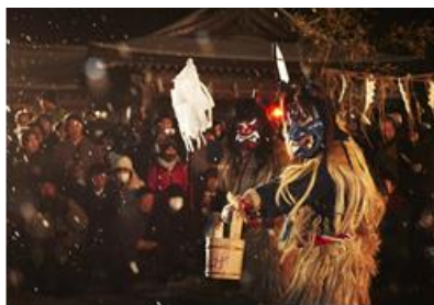
なまはげ柴灯まつり（男鹿市）

毎年8月16日から18日に行われ、にぎやかで勇ましいお囃子と、美しい踊りの調和が特徴で、日本三大盆踊りの一つです。