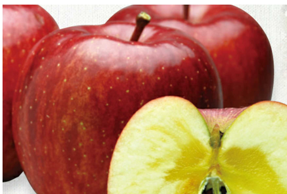
秋田紅 べに あかり

「王林」と「千秋」というりんごの品種のかけ合わせから生まれた秋田県のオリジナル品種です。あざやかな赤色に星がちりばめられたような外観で、酸味が少なく、際立つ あま 甘みが特長です。