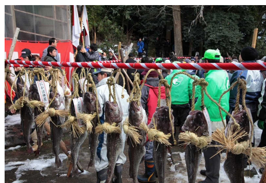
掛魚まつり かけよ （にかほ市）

内容：男鹿市にある真山神社 しんざん で行われます。境内にたき上げられた灯火のもとでくり広げられるナマハゲの乱舞 らんぶ は勇そうで、はく力があります。