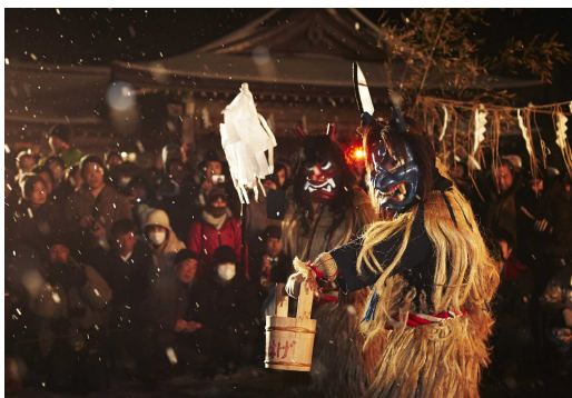
なまはげ柴灯祭り（男鹿市）