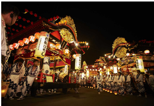
花輪祭りの屋台行事（鹿角市）