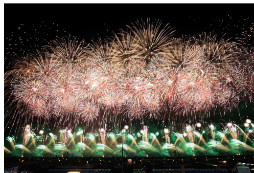
全国花火競技大会「大曲の花火」（大仙市）

内容：日本三大ばやしにも数えられる祭りばやしと、ごうかな屋台のエネルギーギッシュなお祭りです。