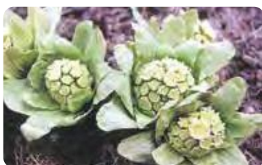
県の花：ふきのとう