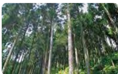
県の木：秋田杉 すぎ