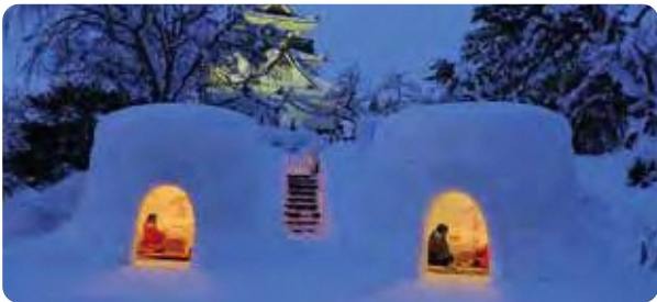
横手のかまくら（横手市）

時期：毎年8月3日から6日まで 内容：いなほに見立てた竿灯をあやつりながら、力と技を競います。東北三大祭りの一つです。