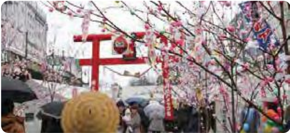
大館アメッコ市（大館市）

時期：毎年2月第2土曜日とその翌日 内容：様々なアメを販売する店が立ち並びます。その日にアメを食べるとかぜをひかないとの言い伝えもあります。