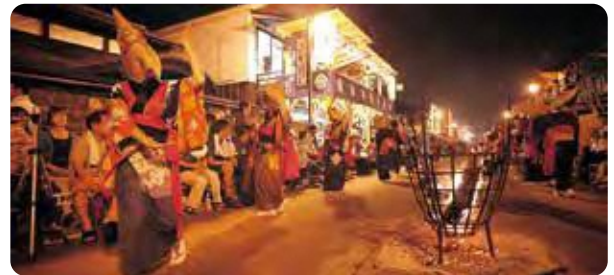
西馬音内盆踊り（羽後町）

時期：毎年2月15日・16日 内容：雪で作ったかまくらの中に水神様をまつり、中に入っている子どもたちがあま酒やおもちをふるまう行事です。