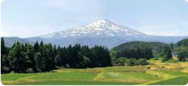
鳥海山（由利本荘市、にかほ市）

田沢湖は、周囲約20kmの円形で、深さが423.4mあり、日本で一番深い湖です。