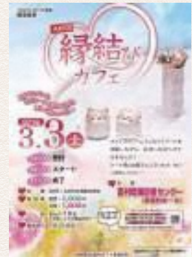
平成28年度には、およそ3,000人が出会い・婚活イベントに参加しました!