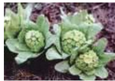
県の花：ふきのとう