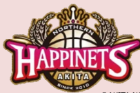
秋田ノーザンハビネッツ