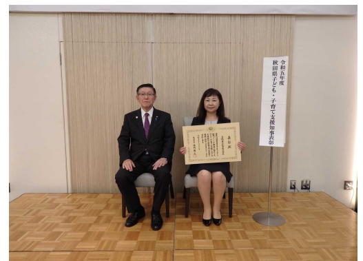
令和5年度表彰の様子