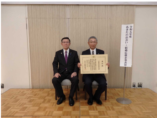
令和5年度表彰の様子