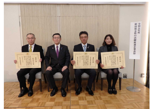
令和5年度表彰の様子