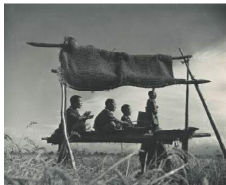
《雀追い》千葉禎介 1943(昭和18)年頃

「出前美術館」は、近代美術館から遠隔地にあり、来館が難しい地域に当館が出向いて行う展覧会です。今年度は、北秋田市文化会館(ファルコン)にて開催します。当館所蔵の日本画、油彩画、工芸、彫刻、版画、写真、書、素描など、あわせて55点を展示します。秋田蘭画《不忍池図》、《芍薬花籠図》(ともに小田野直武筆)のレプリカも展示します。開場10:00～16:00 入場無料 (担当:小林)