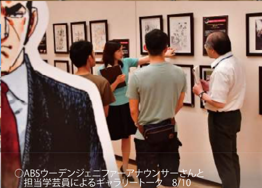
○ABSウーデンジェニアアウンサーさんと担当学芸員によるギャラリートーク 8/10