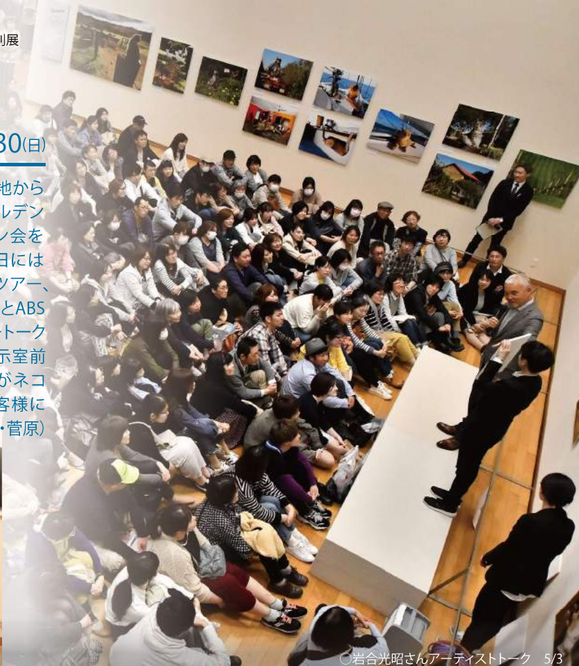
○岩合光昭さんアーティストトーク 5/3