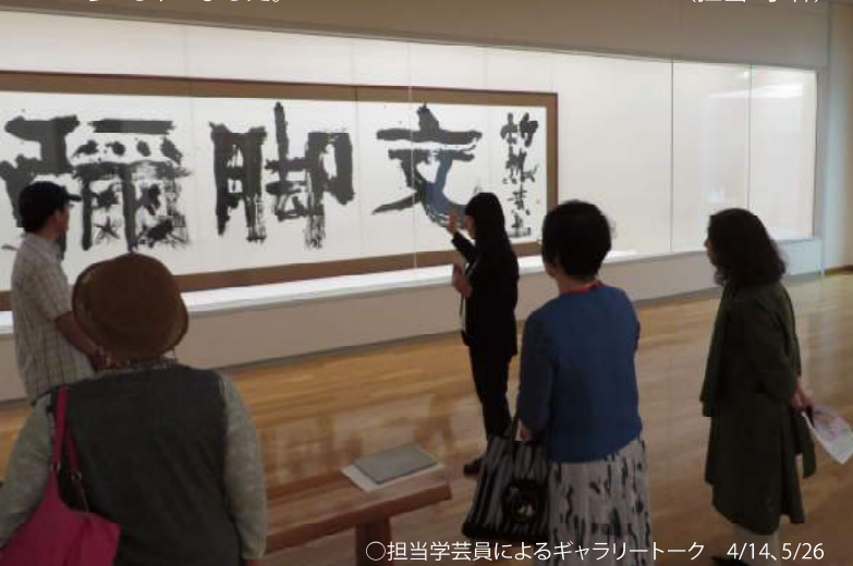
○担当学芸員によるギャラリートーク 4/14、5/26