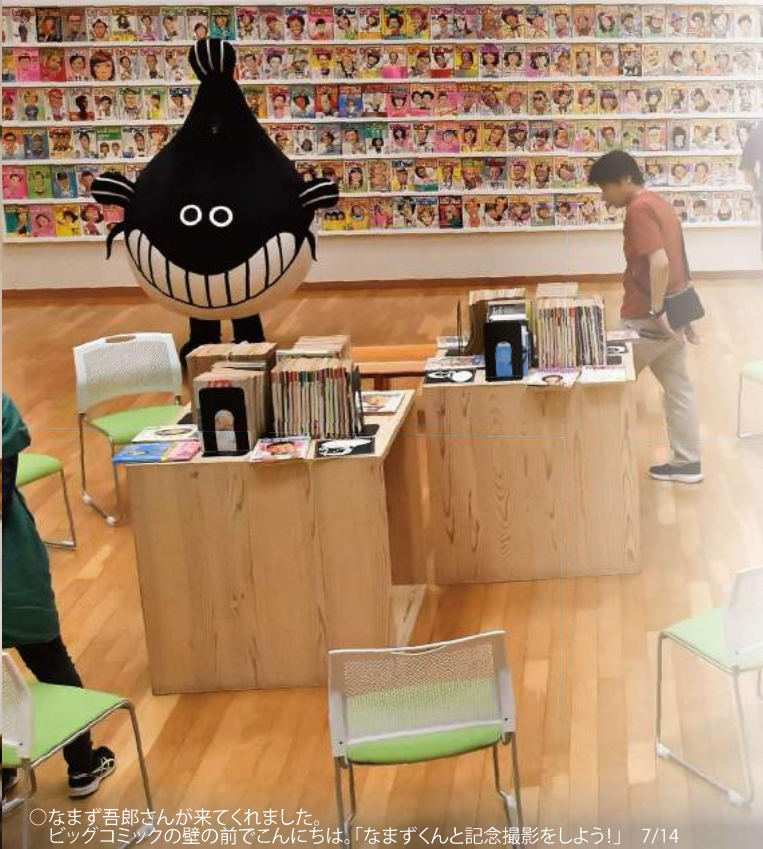
○なまず吾郎さんが来てくれました。ビッグコミックの壁の前でこんにちは。「なまずくんと記念撮影をしよう！」 7/14

本展では、誌面を飾った数々の名作や力作の原画と、本誌570冊を並べて、それぞれの時代に注目された人物を描いてきたビッグコミックの表紙をご覧いただく「ビッグコミックの壁」を展示し、新たな表現に挑み続けた半世紀の歩みを振り返りました。 (担当:鈴木秀一・藤井)