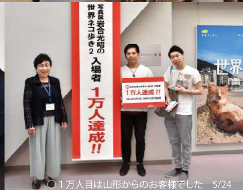
○1万人目は山形からのお客様でした 5/24