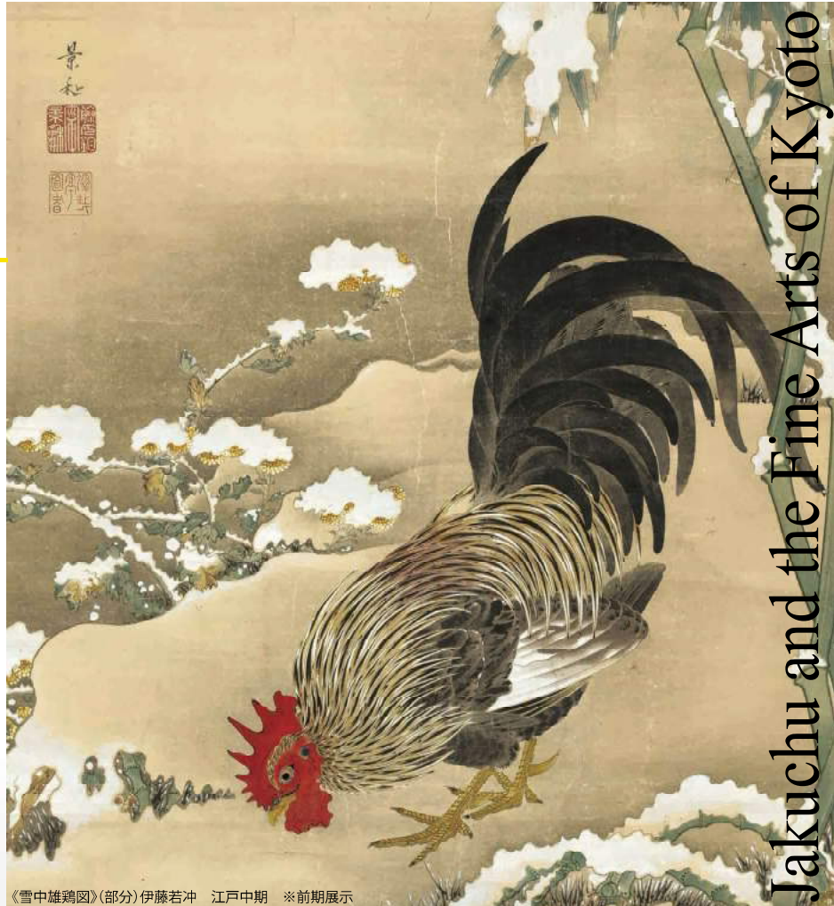
《雪中雄鶏図》(部分)伊藤若冲 江戸中期 ※前期展示

○ ワークショップ「墨で描こう、若冲到挑戦！」 好きな時間に、自由に描くコーナーです。 10/27(日) 10:00～15:00 事前申込不要・先着50名 会場:当館1階実習室 参加無料