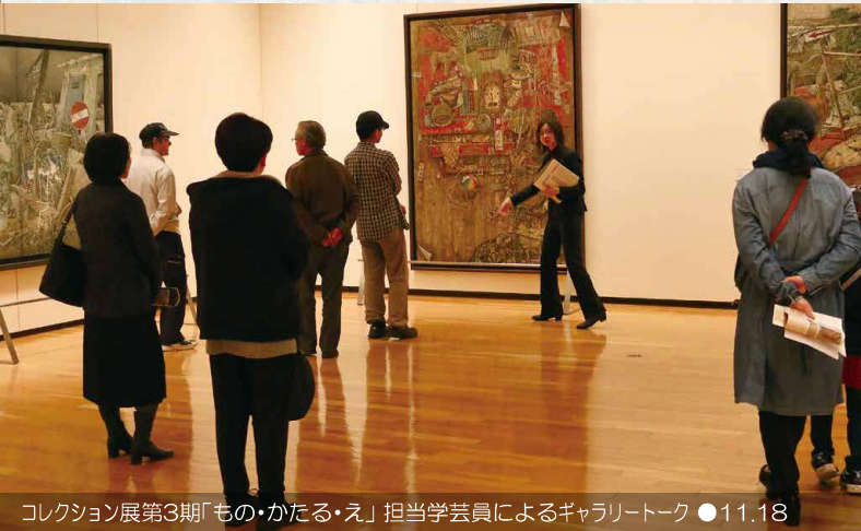
コレクション展第3期「もの・かたる・え」担当学芸員によるギャラリートーク ●11.18

2018コレクション展 第3期 2018.11.14(水)－2019.1.27(日)