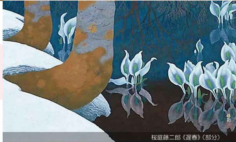
桜庭藤二郎《遅春》(部分)