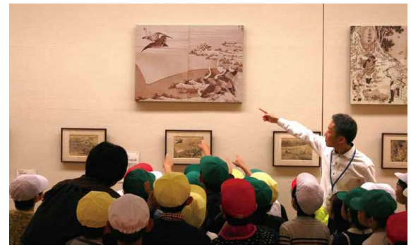
【北海の富士 富嶽三十六景と富嶽百景】(4.21～6.17) 鑑賞の様子

開館25年 秋田県立近代美術館 Akita Museum of Modern Art