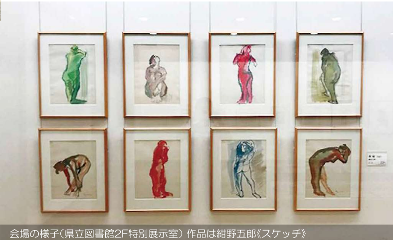
会場の様子(県立図書館2F特別展示室) 作品は紺野五郎《スケッチ》

2018(平成30)年度ネットワーク事業 2018.9.29(土)－10.25(木)