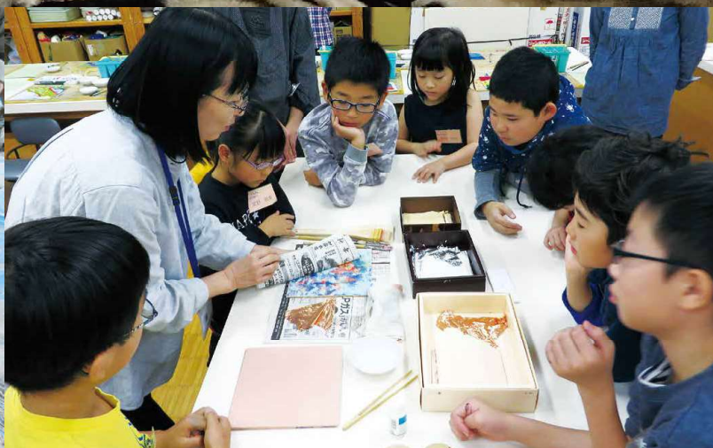
●11月21日:子どものための日本画教室Ⅱ(みんなの教室) 岩絵の具に挑戦! 箔貼り、砂子にも!