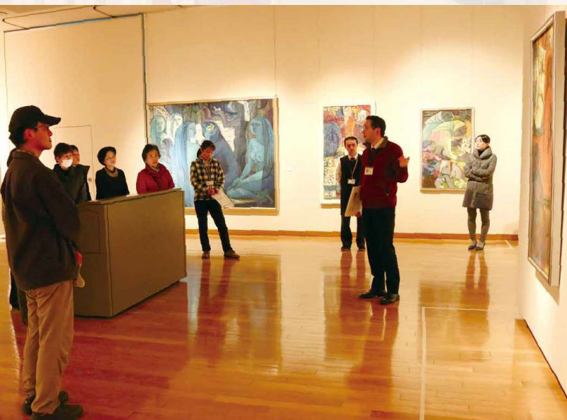
「横山津恵展」担当学芸員によるギャラリートーク ●12.1