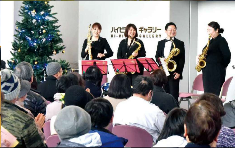
●12月2日:サクソ四重奏(ミュージアムコンサート) 出演:秋田吹奏楽団サクソフオンソカルテット のみなさん