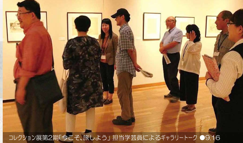
コレクション展第2期「今こそ、旅しよう」担当学芸員によるギャラリートーク ●9.16