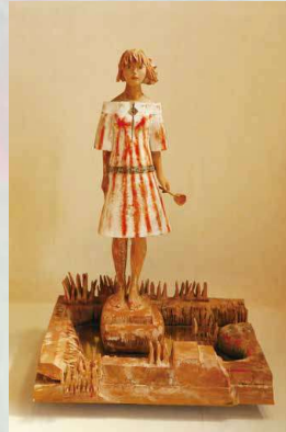
峯田敏郎《記念撮影—遠い目の風音—私のふるさと—》