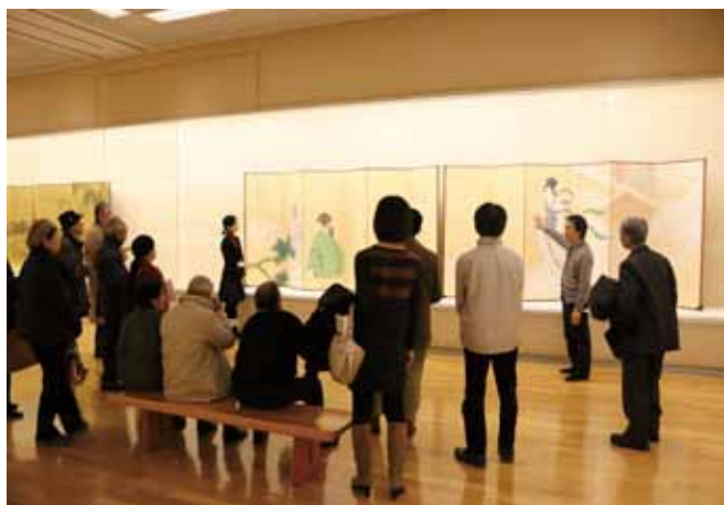
オープン前の内覧会にも多くの方にご参加いただきました！ ●12月2日