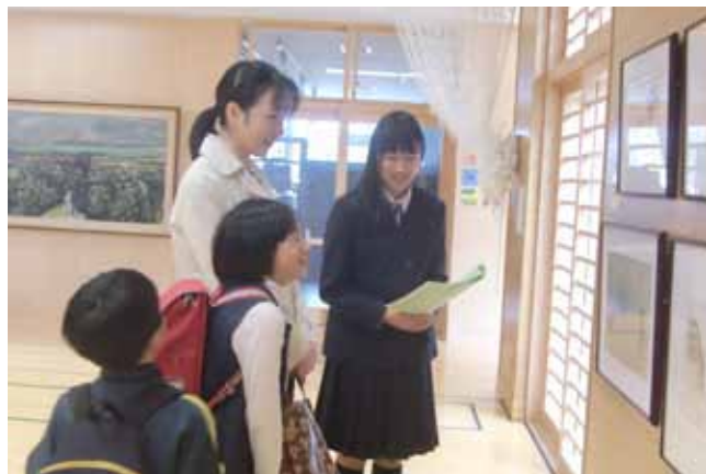
笑顔でやさしく解説！

今年で12年目を迎えた「出前美術館」。「出前美術館」は、どこの地域の学校でも芸術作品の鑑賞ができるようにと、来館の難しい地域に美術館が出向いて実施している展覧会です。