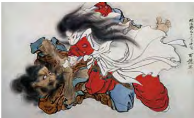
ヤマトタケル、宿敵を討つ！ ●平福百穂「武尊誅泉師図」1893年