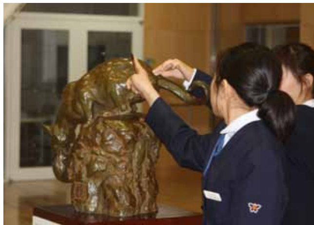
見て、触って動きを確かめて