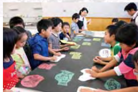
●10月4日：セカンドスクール「版画を楽しもう」・横堀小

小学校 56 校、中学校 19 校、高等学校 9 校、特別支援学校 3 校、幼稚園・保育所 5 園、その他 18 団体。のべ 110 団体、2,875 人（12 月 31 日現在）