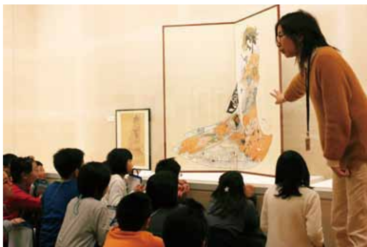
目玉作品の一つ「地獄太夫」でギャラリートーク(高梨小セカンドスクール) ●11月24日