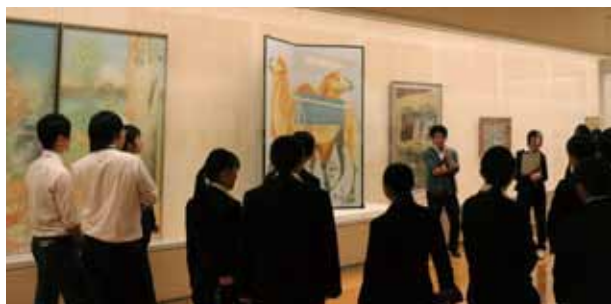
由利本荘看護学校のセカンドスクールでの様子 ●10月14日