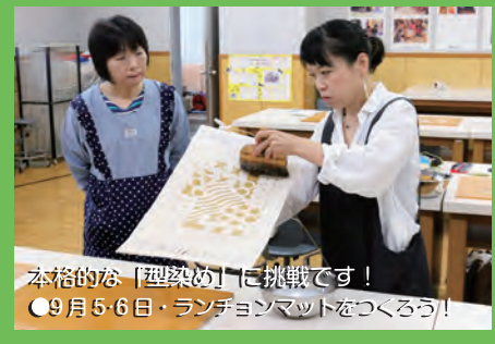
本格的な「型染め」に挑戦です！ ●9月5・6日・ランチョンマットをつくろう！