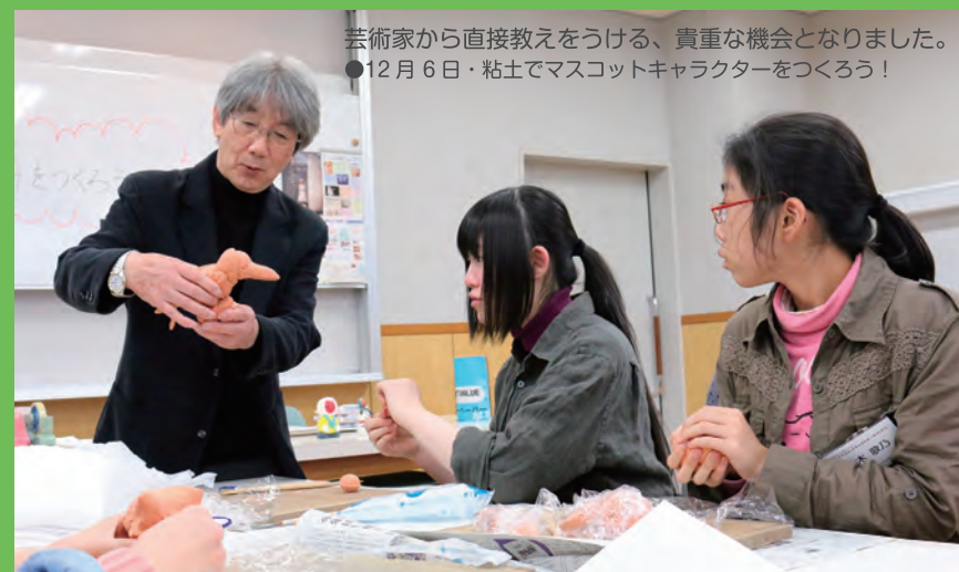
芸術家から直接教える、貴重な機会となりました。 ●12月6日・粘土でマスコットキャラクターをつくろう！