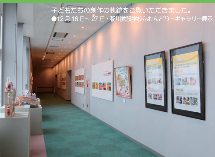
子どもたちの創作の軌跡をご覧ください。 ●12月16日～27日・稲川養護学校ふれんどりーギャラリー展示