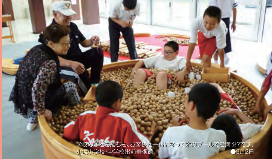
学校の子どもたちも、お客様と一緒に木製のプールで満悦?です。 小坂小学校・中学校出前美術館 ●9月2日