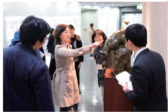
●美術館にある彫刻でどんな鑑賞ができるか皆で話し合いました！