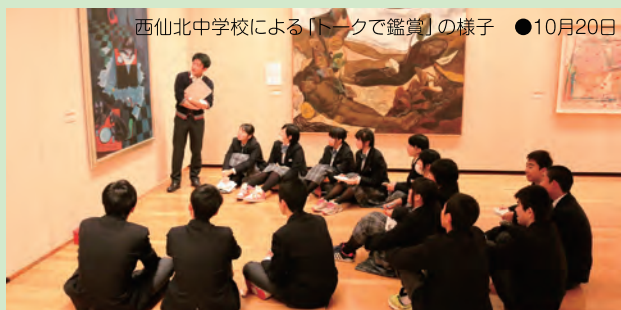
西仙北中学校による「トークで鑑賞」の様子 ●10月20日