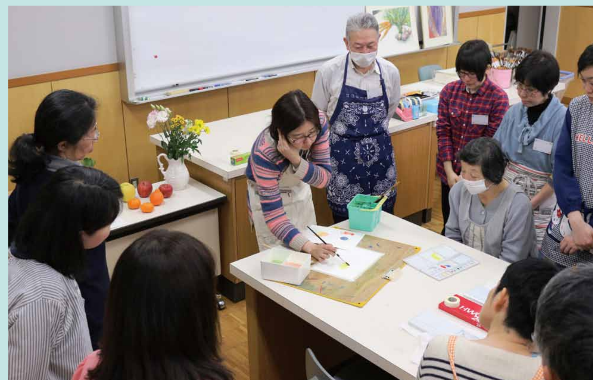
3. 透明水彩について、基礎的な扱い方をレクチャー。