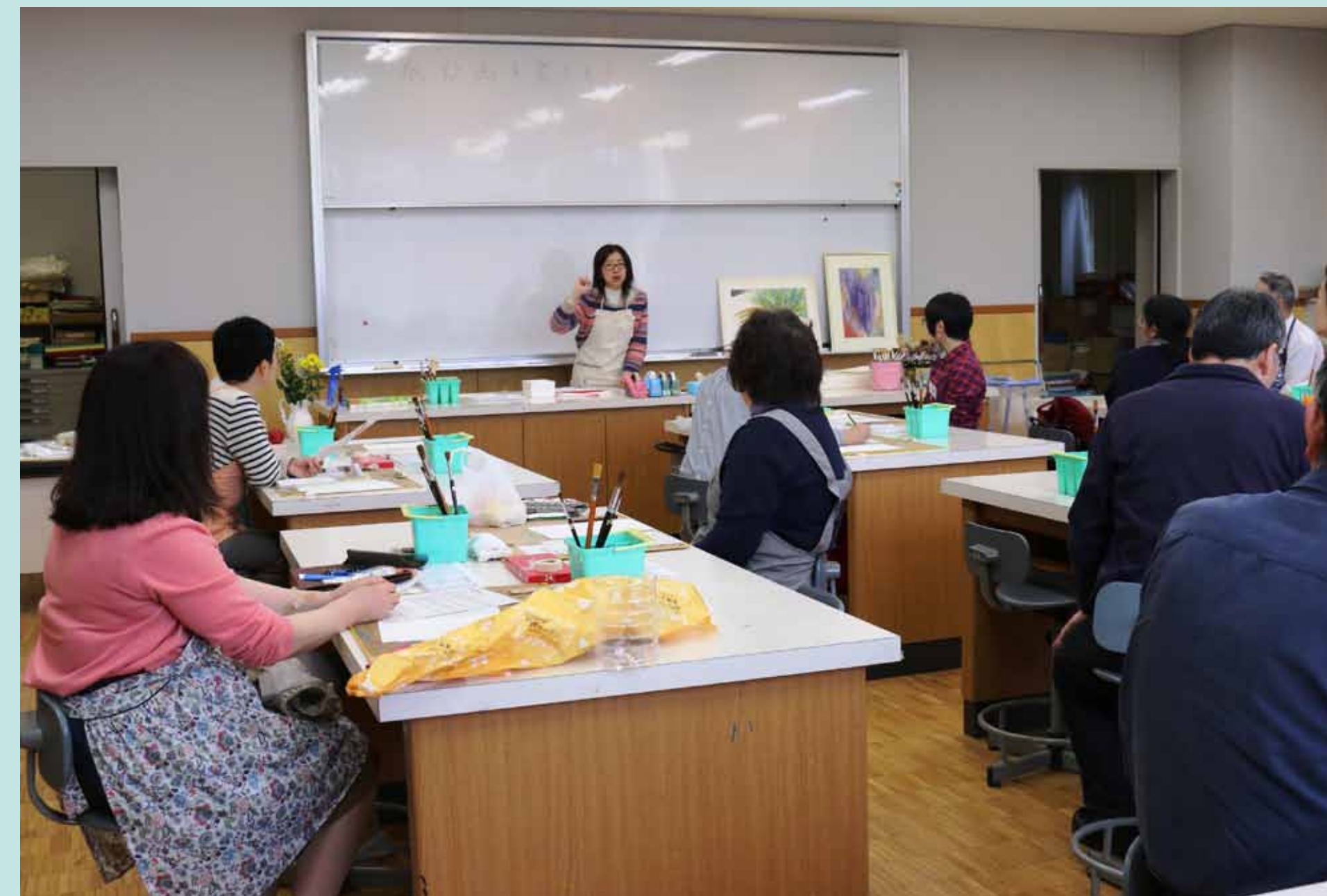
1. オリエンテーション。「今日は水彩画を楽しみましょう！」