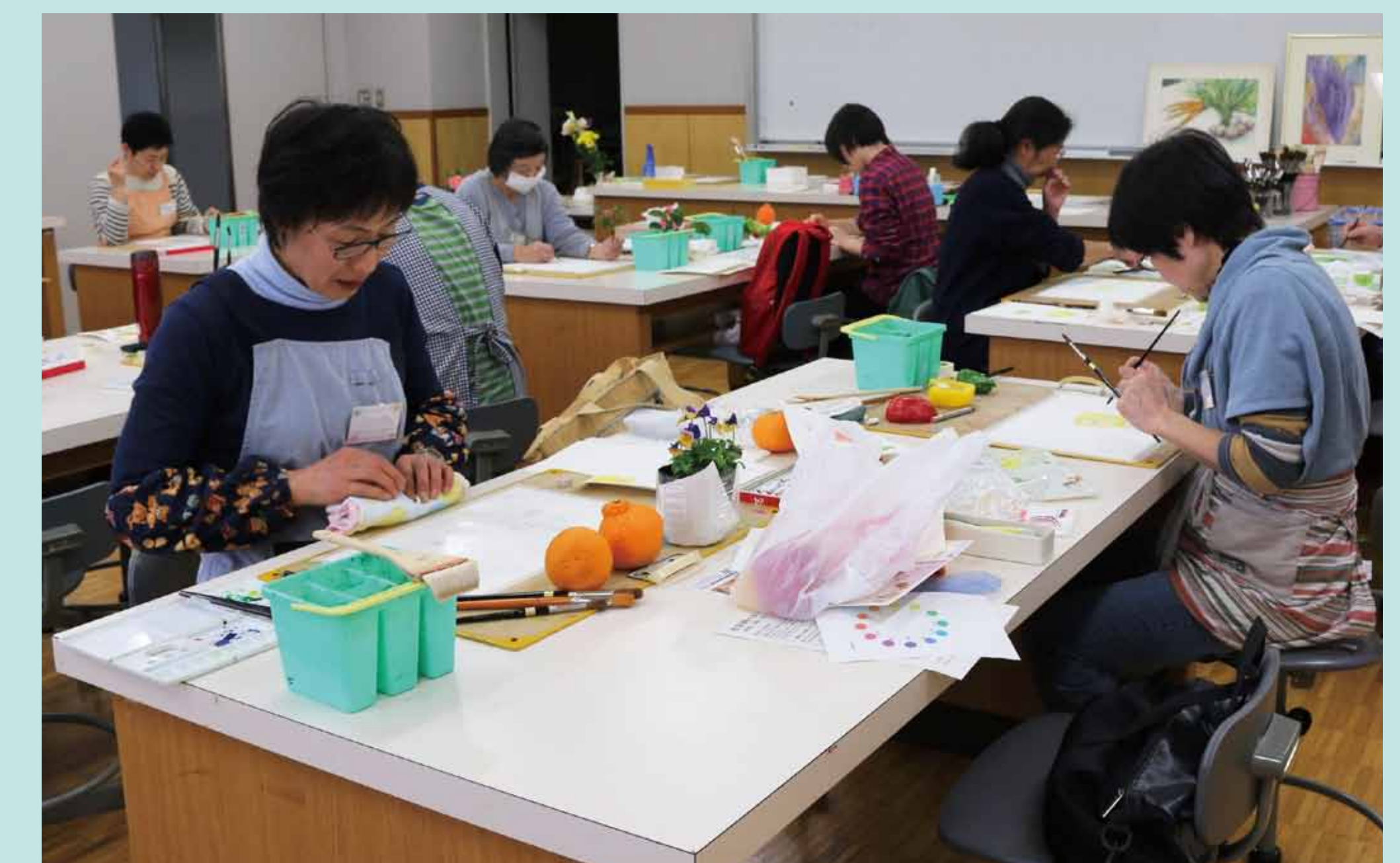
6. 透明水彩ならではの、発色や仕上がりを楽しみました。