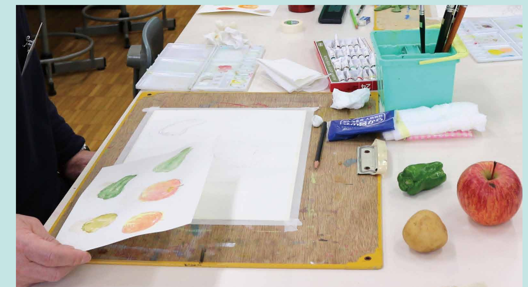
5. ハイライトの部分を残しながら…、描きすぎないことが大事ですね。