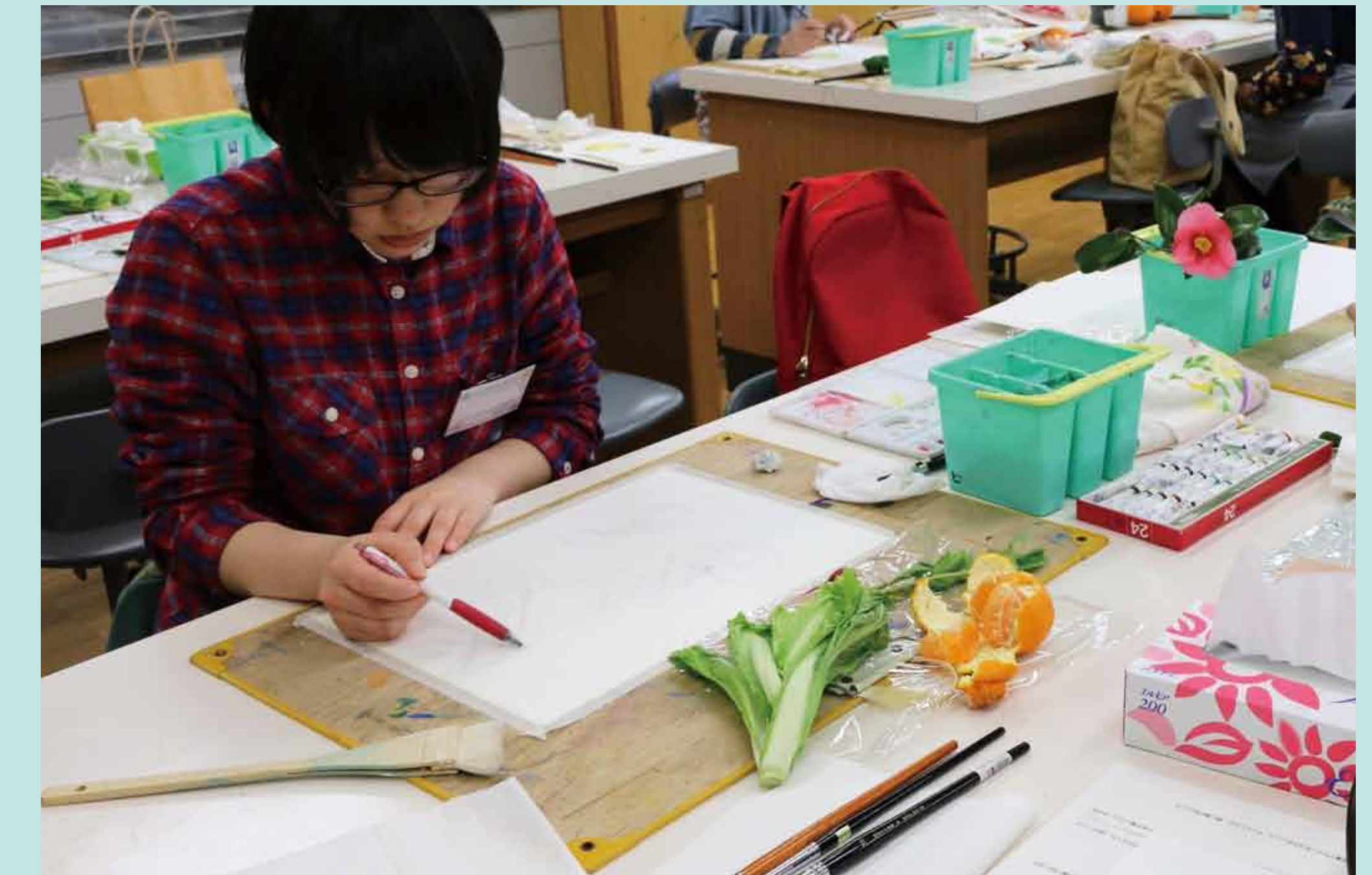
4. 構図のバランスを考えながら、鉛筆でスケッチ。