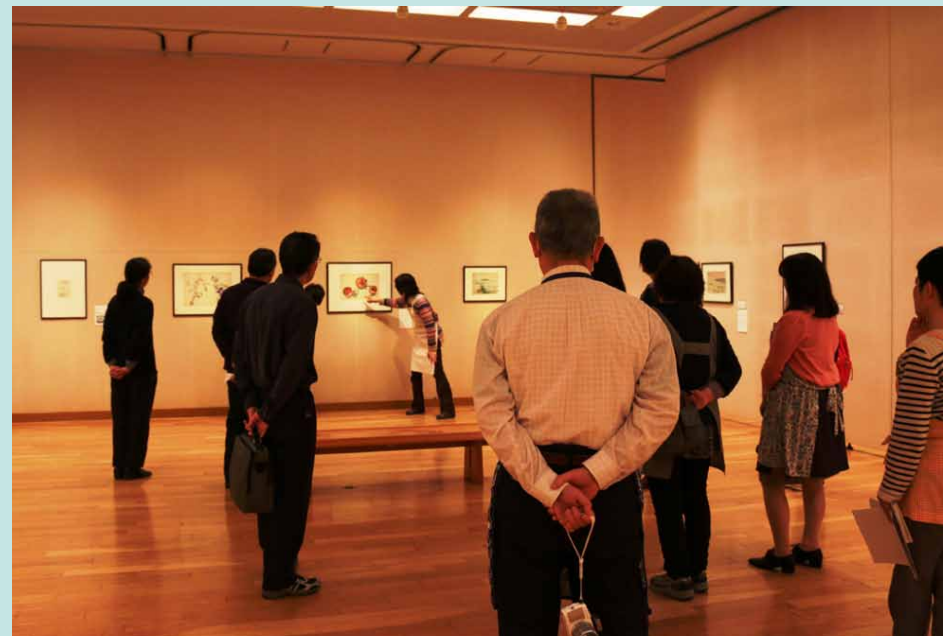
2. 「日々の写生展」の会場に移り、じっくりと作品を鑑賞。