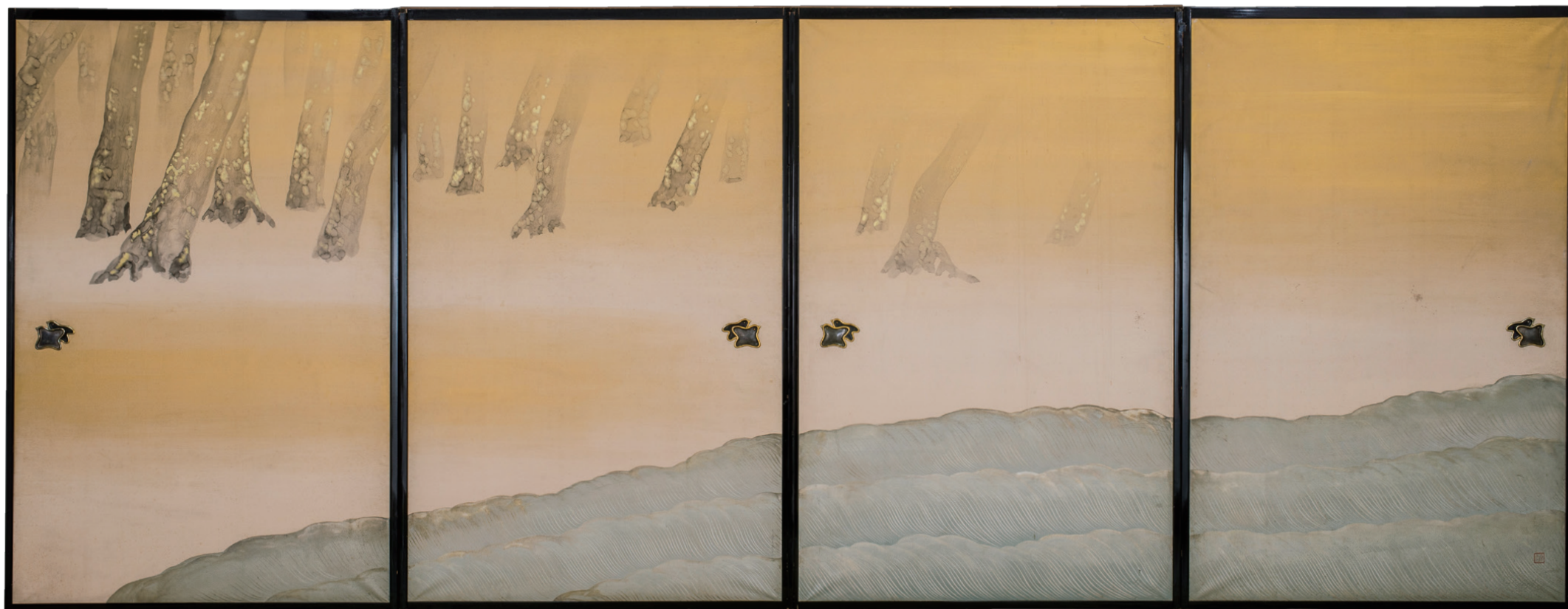
寺崎廣業《春秋図》(部分) 1905(明治38)年