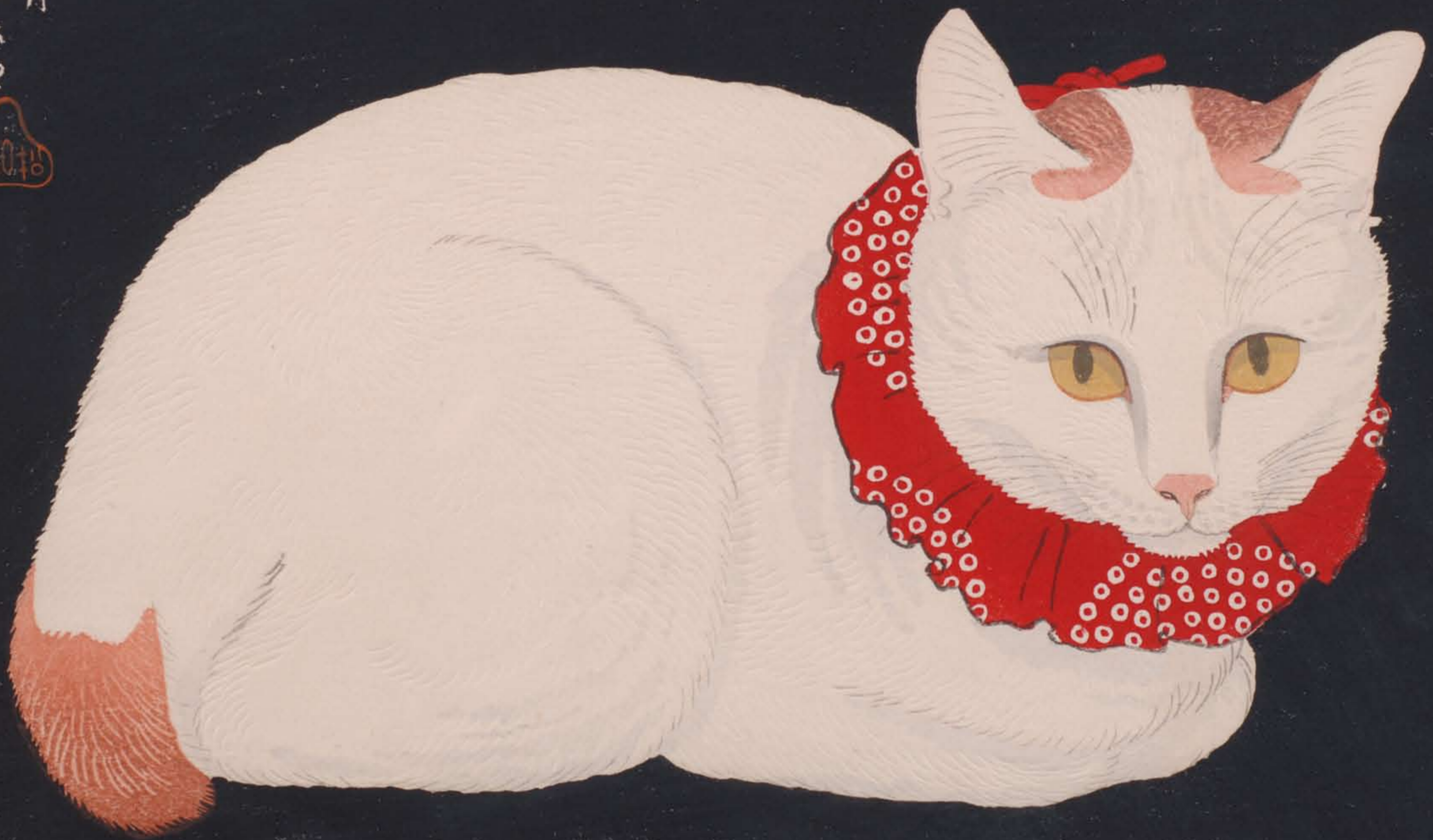
高橋弘明《ジャパニーズ・ポブテイル》1924年 紙・木版 23.5×33.0