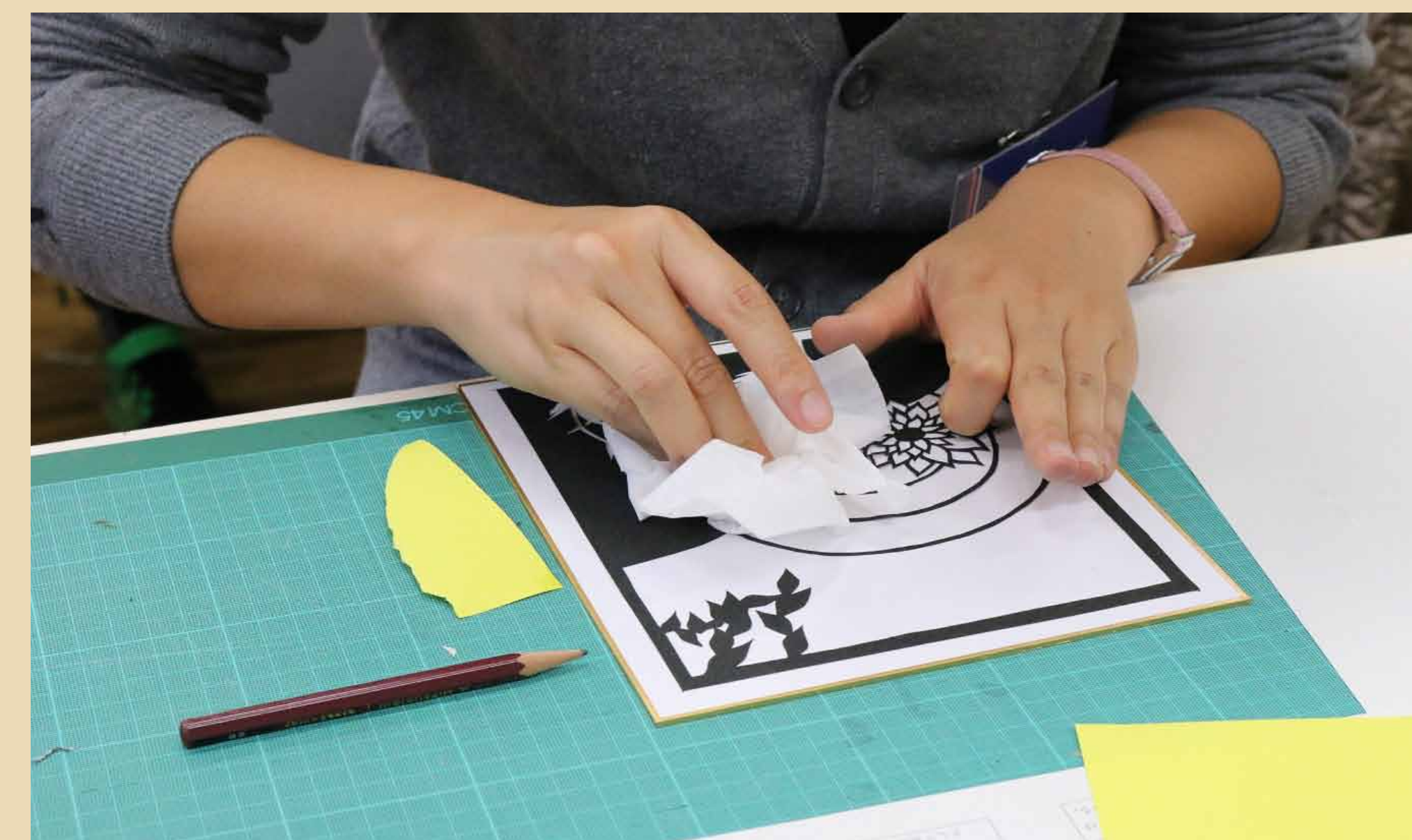
5. 黒和紙をのり付け、はみ出した部分はティッシュでふきとります。