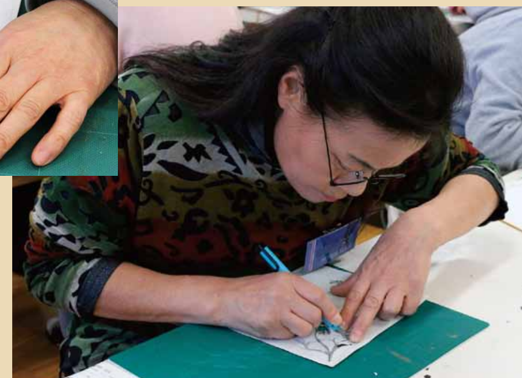
3. 下絵と黒和紙を重ねカッターで切り抜きます。慎重に・・・！