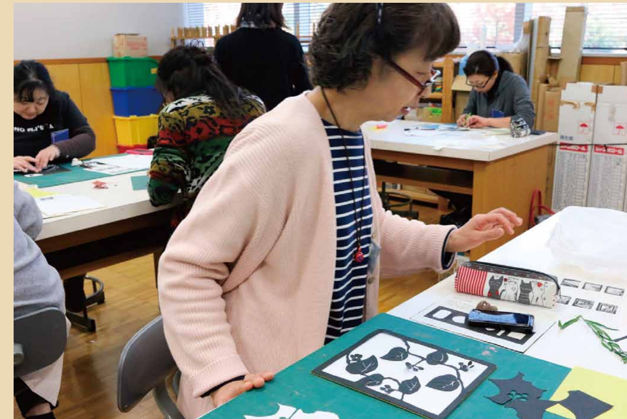
4. 切り抜いた黒和紙を台紙の上において、最終チェック！