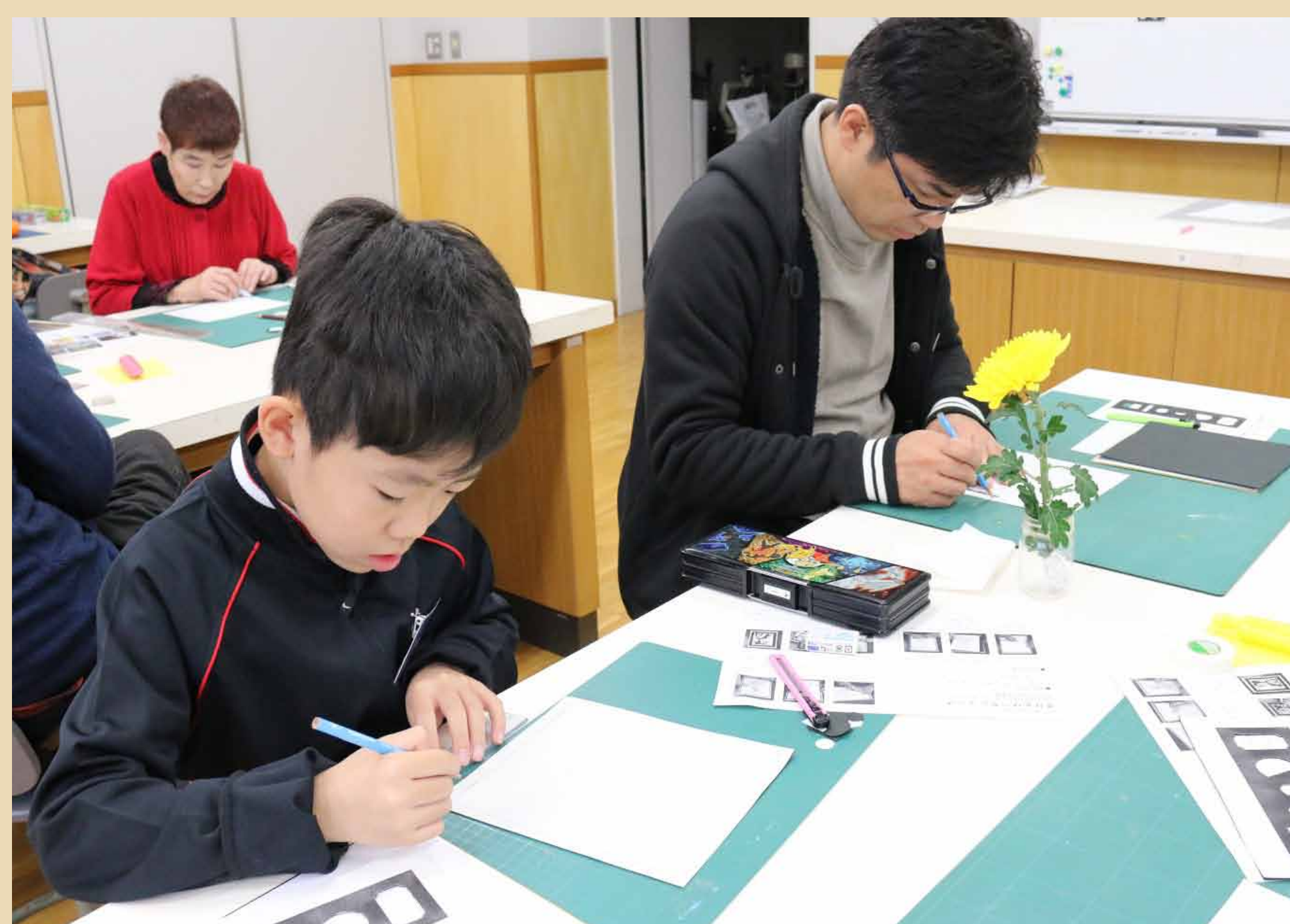
2. 「秋」をイメージしながら、どんな画面にするか考え中。