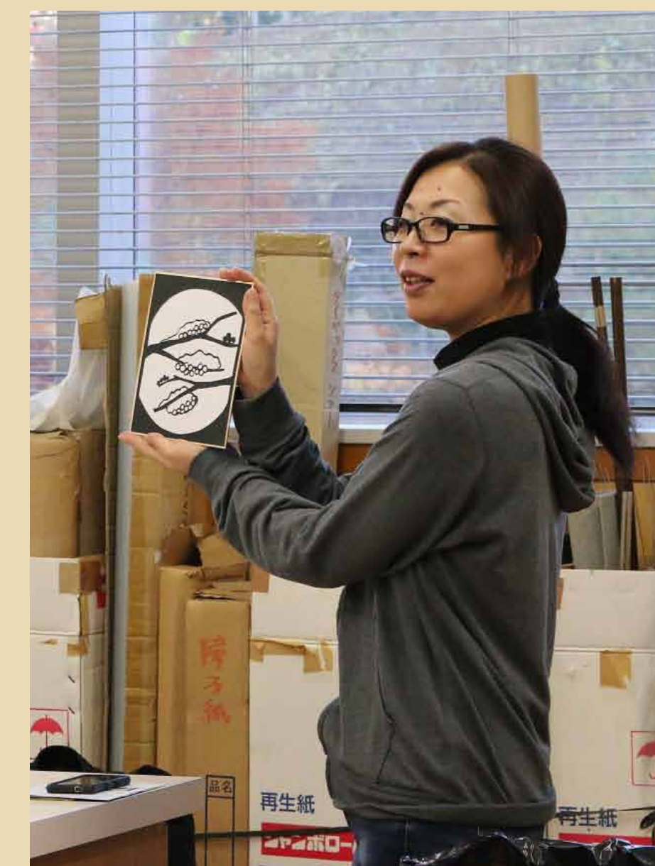
6. 最後はみんなで鑑賞会、ステキな作品がたくさんできました！