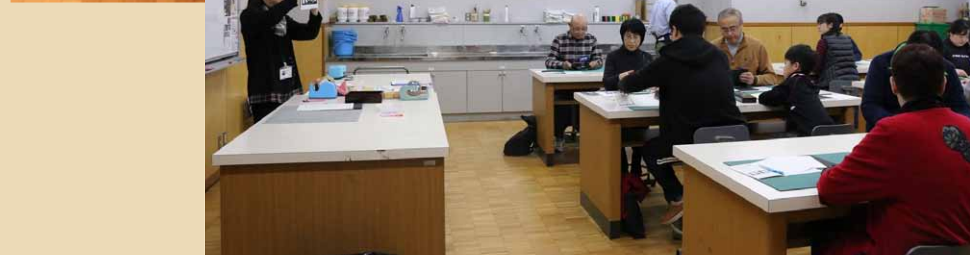
1. 展覧会を鑑賞後、材料、用具、手順についての説明です。