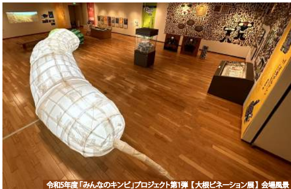
令和5年度「みんなのキンピ」プロジェクト第1弾【大根ピネーション展】会場風景

「みんなのキンピ」プロジェクトは、社会包摂への意識の醸成や美術館がコミュニティとしての役割を担うことを目指す取組です。その成果展として開催する本展の今年度のテーマは「いっしょにつくる」。年齢も暮らし方も異なる人たちがアートを介することで出会い、対話し、つながることで生まれる作品にご期待ください。 【関連イベント】 ギャラリートーク等