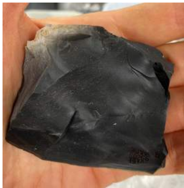
石器(剥片) 秋田県埋蔵文化財センター蔵