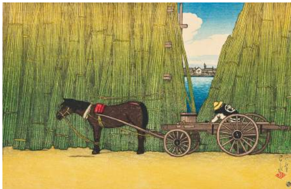
川瀬巴水《東京十二題 こま形河岸》大正8年(1919) 渡邊木版美術画館蔵

伝統的な浮世絵木版技術を用い、高い芸術性を意識した「新版画」は、大正から昭和にかけて国内外で人気を呼びました。その瑞々しい情趣や清新な感覚は、今なお我々を魅了して止みません。本展では、新版画を牽引し世に広めた版元・渡邊庄三郎の挑戦の軌跡をたどりつつ、伊東深水や川瀬巴水らの希少な初摺を通して、新版画の魅力をご紹介します。 【関連イベント】 ギャラリートーク等