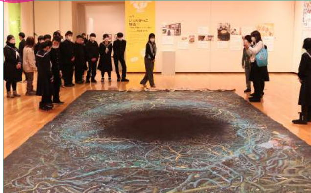
「みんなのキンビ」大根ビネーション展 鑑賞の様子(R5年)

学校の授業の一環として、当館の各種プログラムを無料でご利用いただくことができます。展示会の鑑賞、館内探検等のメニューをご用意しています。幼稚園・認定こども園、保育所、小・中学校、特別支援学校、高等学校等に対応しています。保育園や部活動等についてもご相談ください。「実物との出会い」、「創作活動へのアプローチ」を支援します。