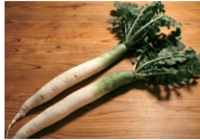
沼山からの贈りもの ~アウトクロップ×沼山大根~