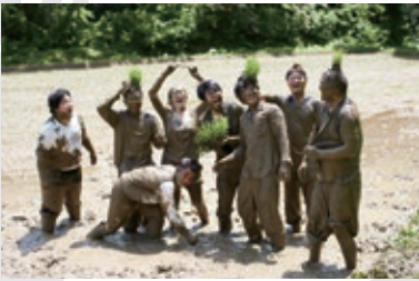
“根”子集落という生き方

年齢や障害の有無にかかわらずぜひ、ご参加ください。 詳細は11月1日以降、当館HPでお知らせいたします。 ※内容等は変更になる場合がございます。