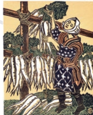
根こそぎ“キンピの掘り出しもの” 農民風俗十二月「大根干」 | 勝平得之