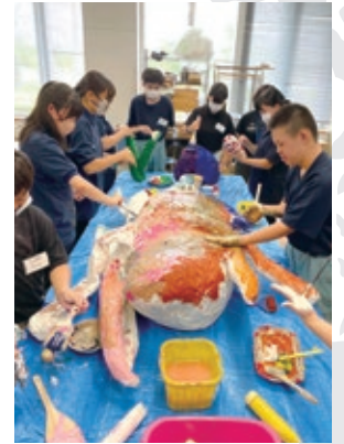
夢の動物 秋田県立栗田支援学校 秋田公立美術大学附属高等学校