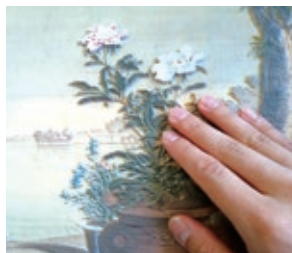
絵画に手で触れる・感じる 秋田県産業技術センター「不忍池園」レプリカ製作