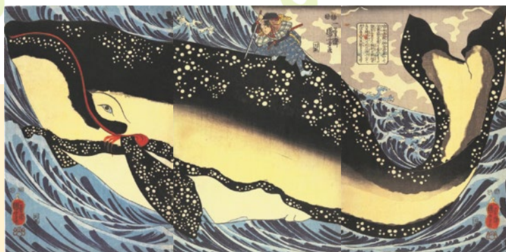
歌川国芳《宮本武蔵の鯨退治》弘化4年(1847)頃 個人蔵