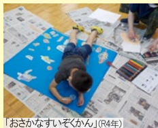
「おさかなすいぞくかん」(R4年)