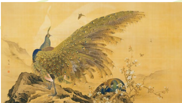
荒木寛敬《孔雀図》1890年 三の丸尚蔵館蔵 ※前期展示