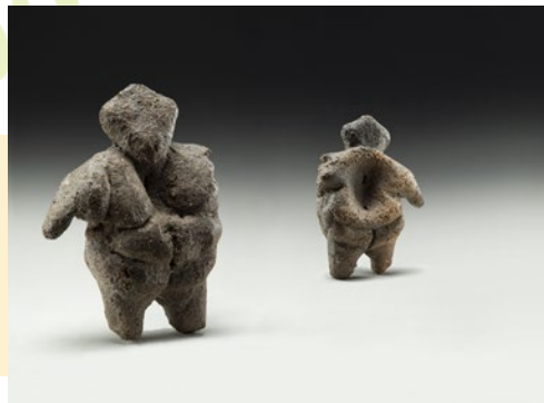
小川忠博《土偶(写真作品)》 ※今朝平遺跡出土、豊田市所蔵