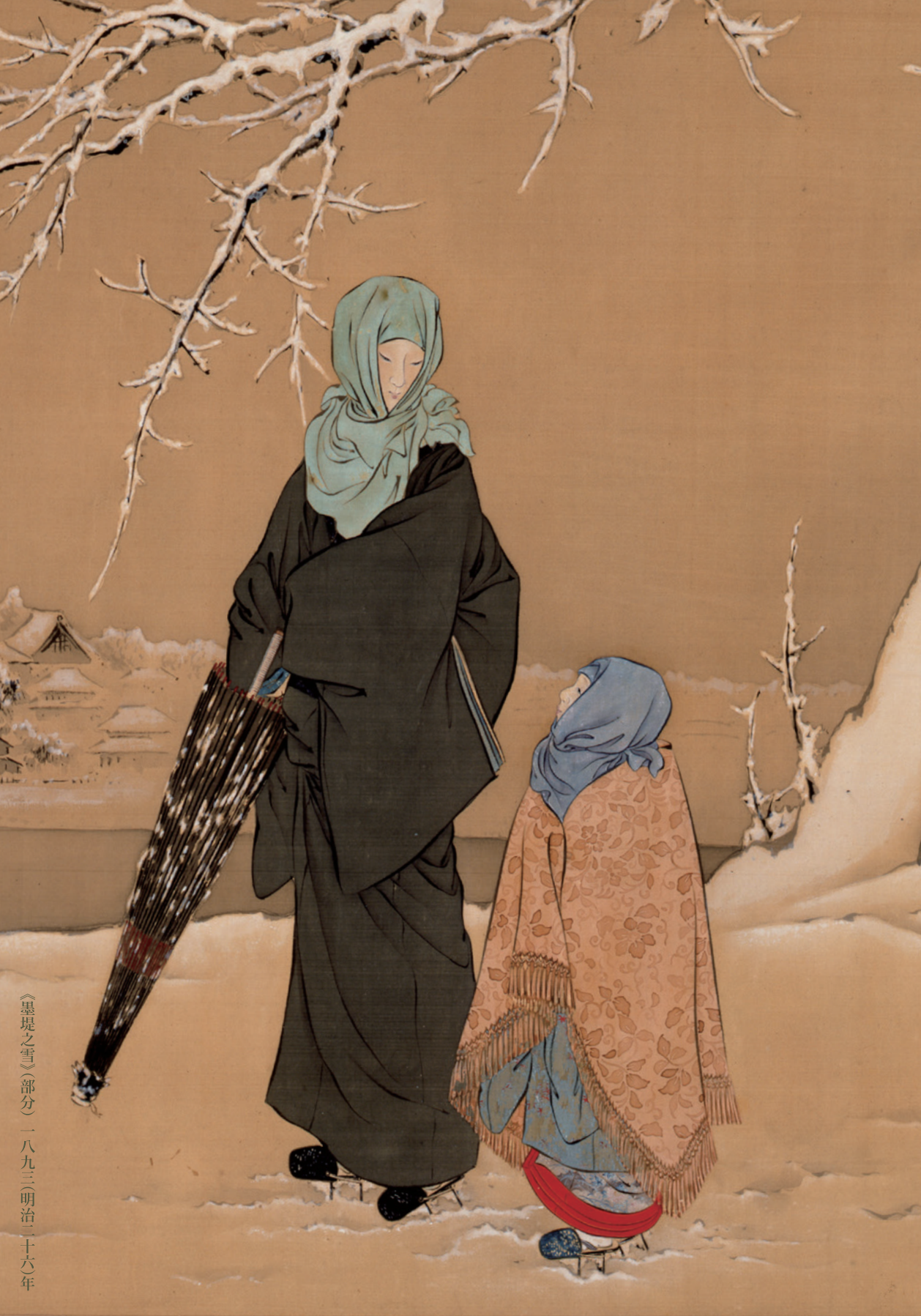
《墨堤之雪》(部分) 一八九三(明治二十六年)