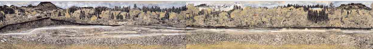
▲《春の最上川》小松均 1974 (昭和49) 年

今回は「山」「水辺」を描いた日本画・洋画・彫刻など55点をご紹介します。ごゆっくりお楽しみください。 ■担当学芸員によるギャラリートーク： 令和2年2月16日(日)、3月1日(日)