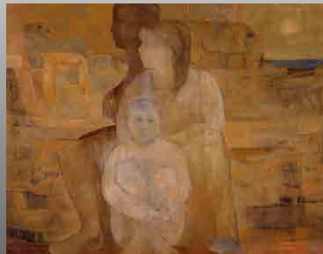
▲《浜》佐藤脩平 1981 (昭和56) 年