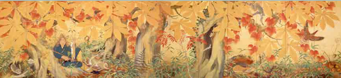
▲《山の秋》福田豊四郎 1931 (昭和6) 年