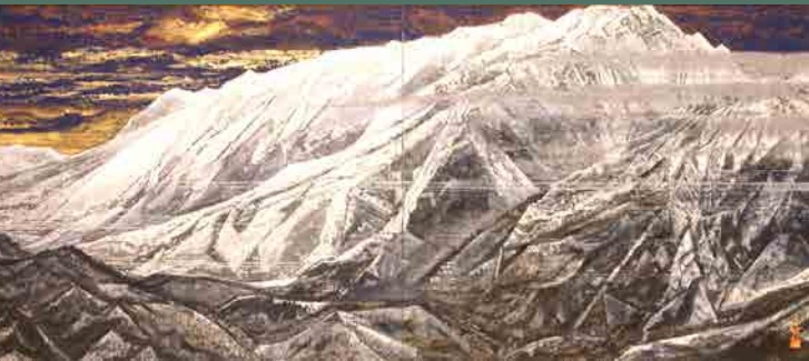
▲《秋田駒ヶ岳》後藤純一 1997 (平成9) 年