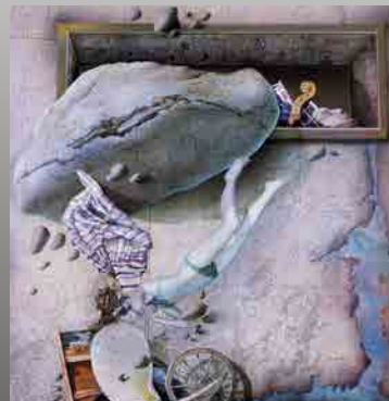
▲《限定海域のものたち》佐々木良三 1983 (昭和58) 年