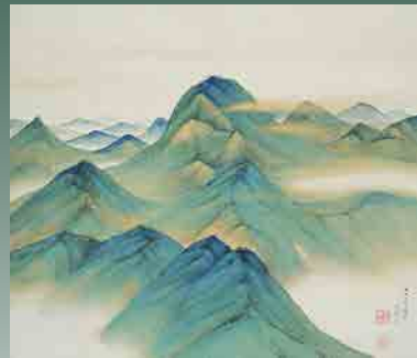
▲《彩雲》平福百穂 1920 (大正9) 年

令和元年度企画展 「山岳の美・水辺の美」 令和2年2月6日(木)~4月13日(月)