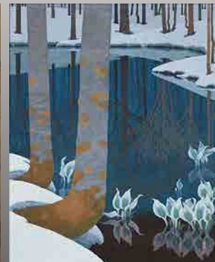
▲《暎春》桜庭藤二郎 1976 (昭和51) 年