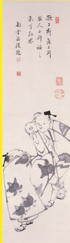
▲《萬歳図》伊藤若冲 江戸中期