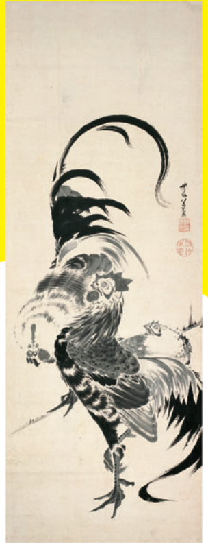
▲《群鶏図》伊藤若冲 寛政八年 後期展示