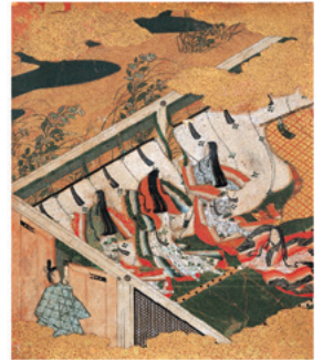
▲《源氏物語図色紙(野分)》 江戸前期