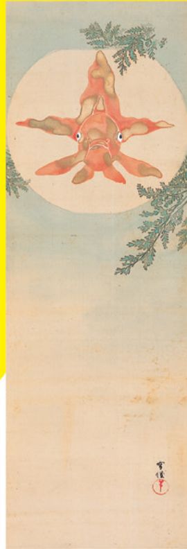
▲《金魚玉図》神坂雪佳 明治末期