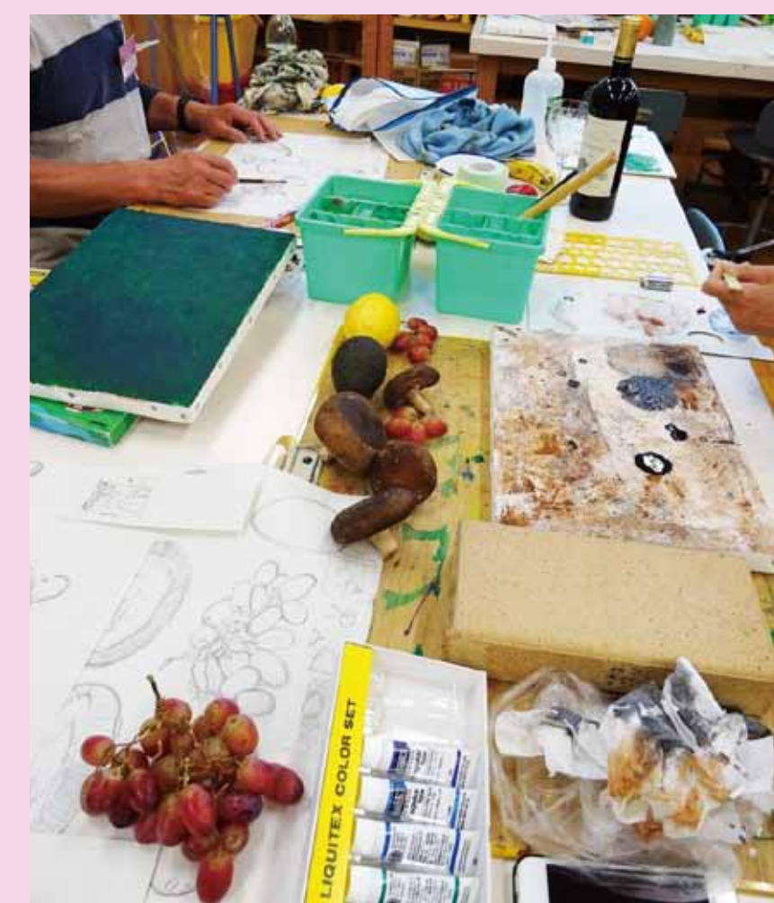
4. 塗ったり、重ねたり、削ったり・・・、複雑なマチエールができそうです。