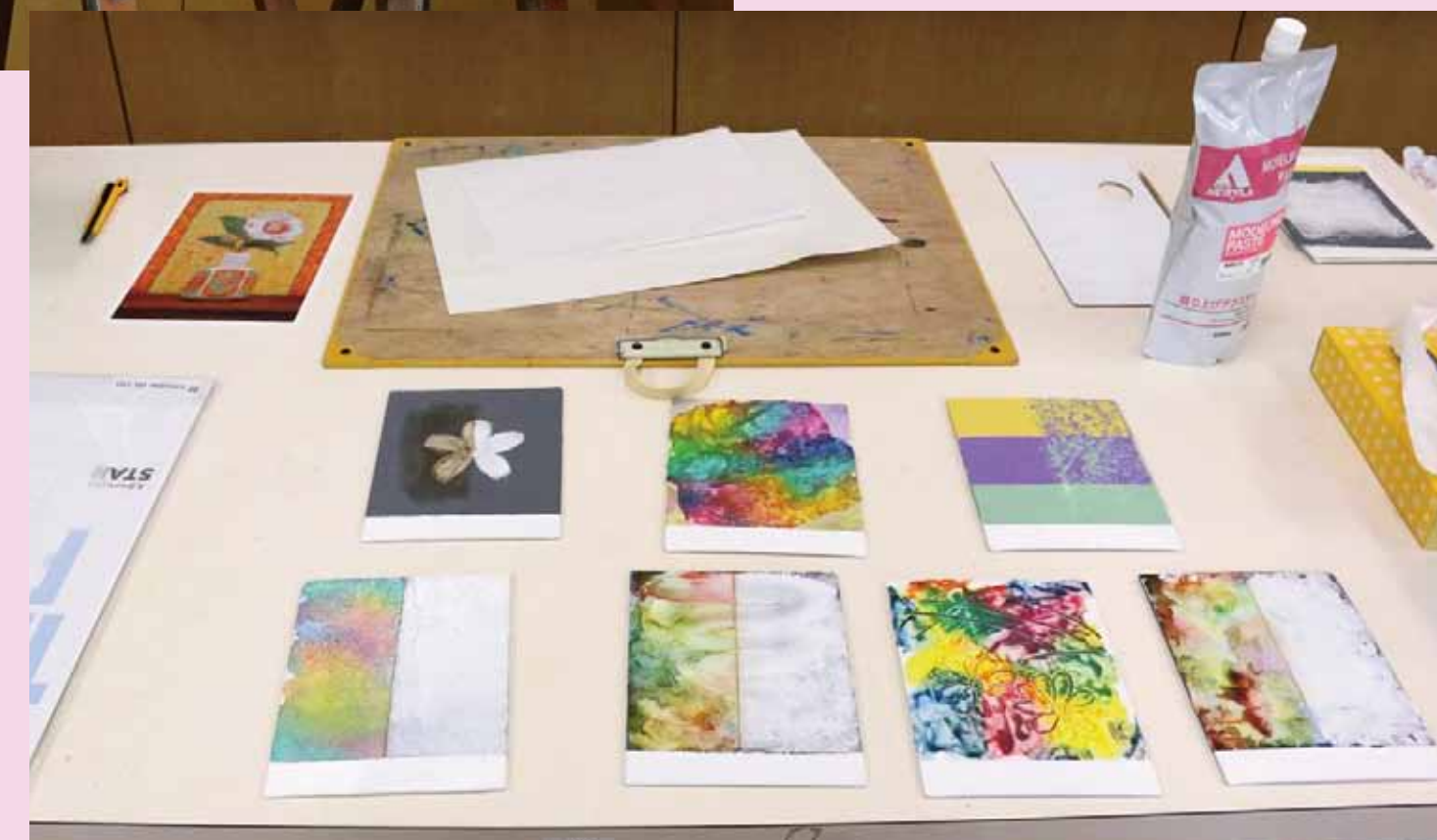
2. 今回はマチエールづくりにこだわってみました。色々な作り方があって迷いそう？