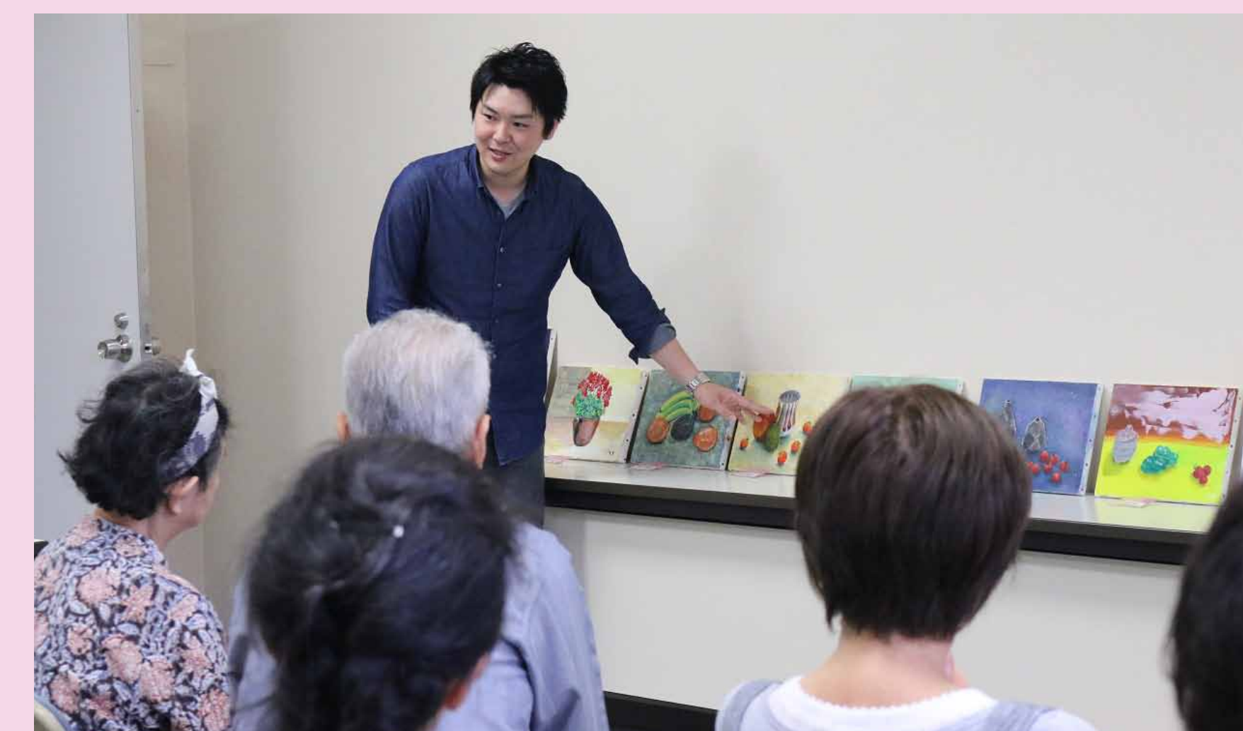
7. 完成作を並べて合評会。他の人の作品にも「ふむふむ」です。