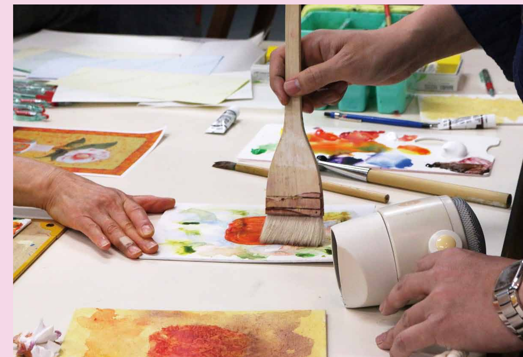
5. 先生が使っているぼかしのテクニックも紹介されました。