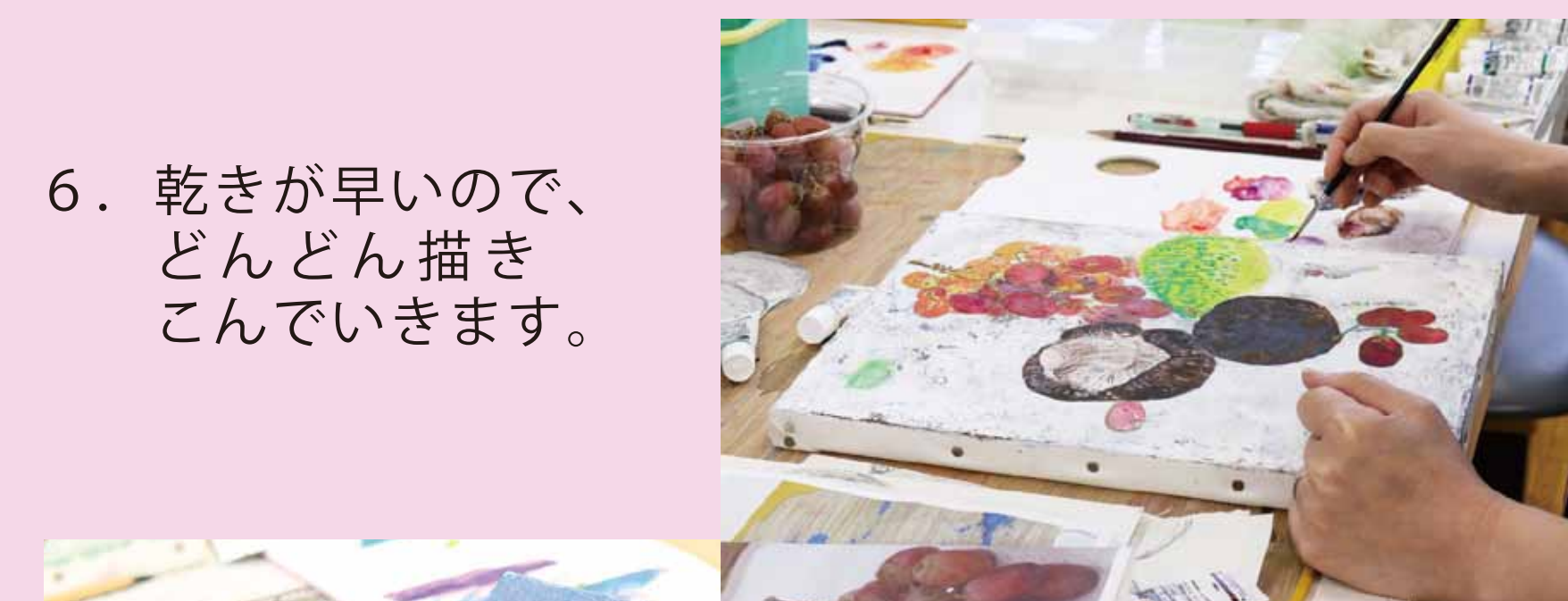
6. 乾きが早いので、どんどん描きこんでいきます。