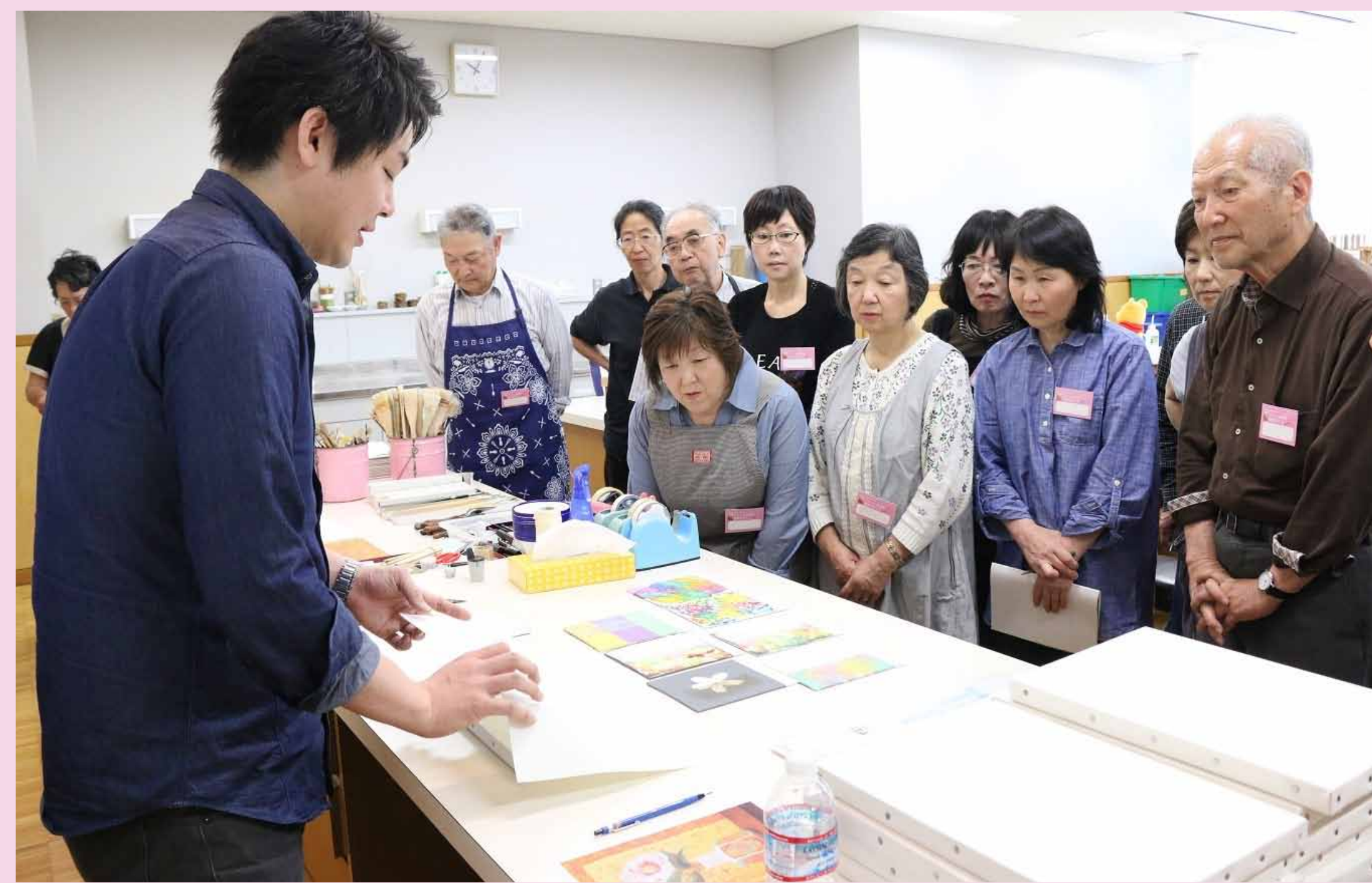
3. マチエールの作り方について説明を。みなさん真剣です！！