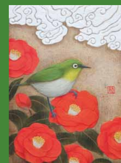
大須賀先生作「梅にメジロ」