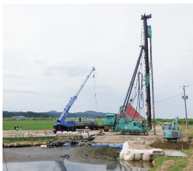
琴丘南地区排水機場工事

又、時短や福利厚生面での向上に積極的に取組むと共に、各種の資格取得にも掛かる費用を全て支援します。