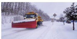
能代国道維持補修工事