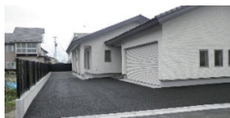
能代市 Y 様邸