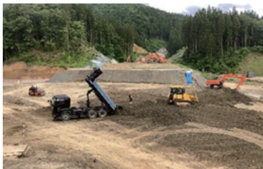
小繋道路改良工事

地域においては、独自にクリーンアップや地域企業へ寄贈を行うなど、長年地域社会に貢献すると共に、ますます成長し続けている企業です。