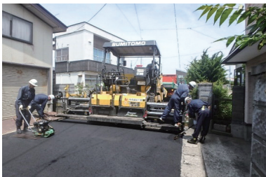
道路を作っています

当社は一般土木工事(道路・下水道・田んぼ)等と商業施設、住宅の造成などの工事を行っています。 特に道路や駐車場の舗装工事は得意分野です。 悪くなった(傷んだ)道路を直し、皆さんが生活しやすいように地域を守っています。