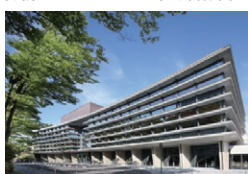
「ミルハス」特定建設工事 共同企業体施工