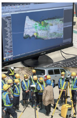
最新ICT施工の社外講習会

＊デジタル技術のICT施工を積極的に導入し、DX建設を進めて生産性・安全性向上を実現しています。