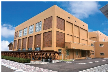
能代松陽高等学校体育館

東北電力、秋田・能代の火力発電所のメンテナンス工事をはじめ、一般電気工事を行っております。機械器具設置工事では主に農業用の大型ポンプの工事等、地域に密着した、地域と共に歩む会社を目指して、日々頑張っています。