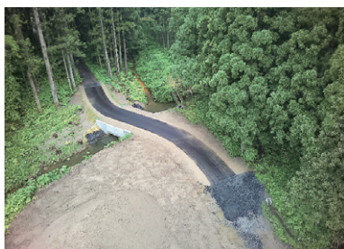
「奥岱橋橋梁改修工事」

「子どもたちの世代においても人と自然が共生できるよう、より良い環境を未来へ引き継いでいきます」をモットーに頑張っています！