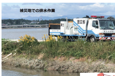
被災地での排水作業

FEEL GRAND'S PULSATION ~大地の鼓動を感じる~ 昭和22年創業以来、社名及び組織の変更し、現在まで土木工事を主とし、能代山本で展開している企業です。公共工事も多く受注しており、地域に貢献し、未来への架け橋となる企業を目指し、日々努力しております。