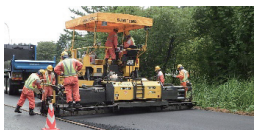
県単道路補修工事

舗装工事を得意としている会社です【街の舗装屋さん】として、公共工事をはじめ住宅の通路や駐車場などの舗装をしています。