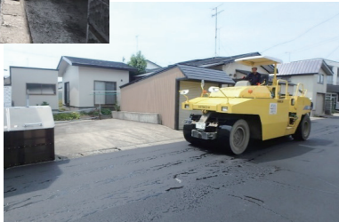
タイヤローラー 転圧中