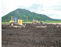
高岳地区農地基盤整備工事