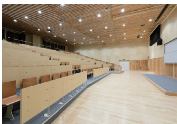
能代科学技術高校 実習棟建築工事

能代市に本社、三種町に本店を置き、能代山本地区～秋田市を中心として、コンクリート構造物工事や河川改修、土地の造成などの一般土木工事、公共施設・民間企業様新築・改築・一般住宅