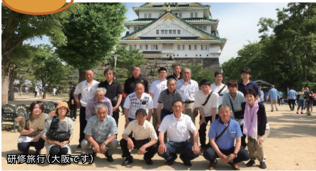
研修旅行(大阪です)