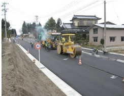
地方特定道路整備工事