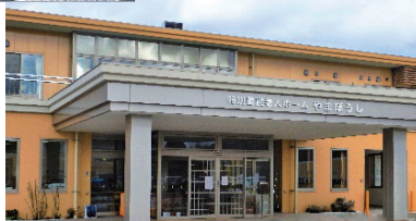
特別養護老人ホームやまぼうし