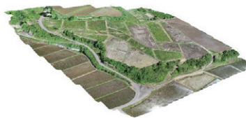
空撮による3Dモデル