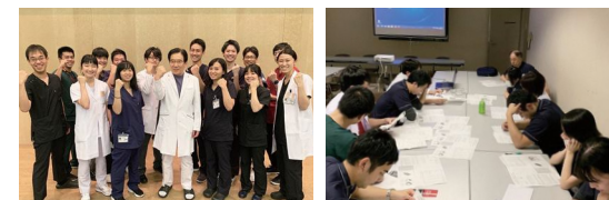
▲見学に来て雰囲気の良い感じてください