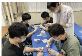
▲総合トレーニング