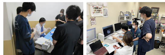
▲臨床に役立つ勉強会(年50回)