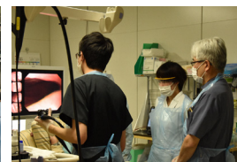
▲指導医と共に内視鏡検査