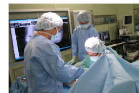
▲助手として手術に参加