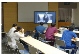
▲月2の救急画像検討会