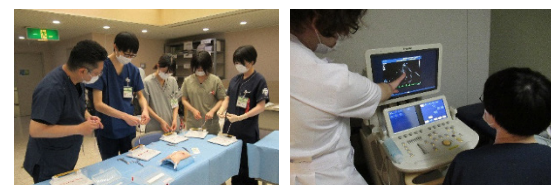
▲総合実習のようす。皆で楽しく学んでいます！ ▲エコー講習会のようす。全集中で取り組んでいます！