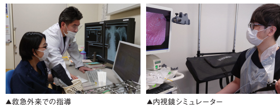
▲救急外来での指導