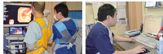
▲指導医と共に内視鏡検査(ERCP)