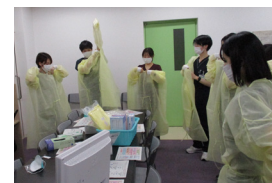
▲ガウン装着講習会①