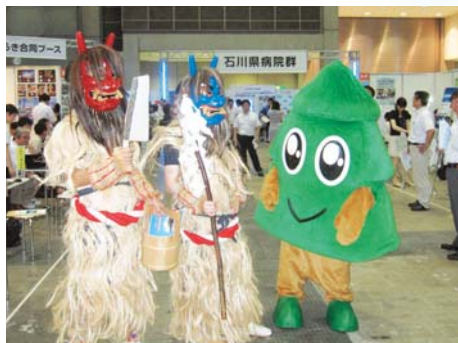
スギッチとなまはげ