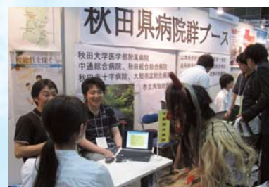
うなずくなまはげ