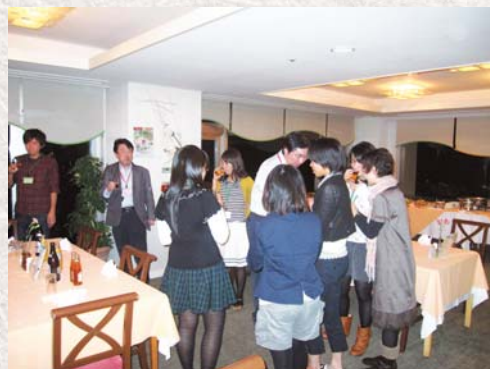
(昨年の懇親会。盛り上がりしましたよ)