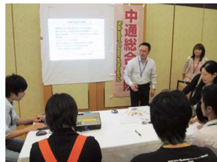
中通総合病院のブース説明

震災により、春休み中の病院見学が十分出来なかった学生へ情報提供する機会を設けようと、この時期の開催となりましたが、通常の病院ブース説明の他、秋田県の初期研修、後期研修の取組についての紹介もあり、参加された学生のみなさんの病院選択の参考にしていただければと期待しています。