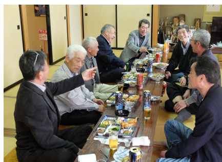
4月17日の保食神社のお祭り