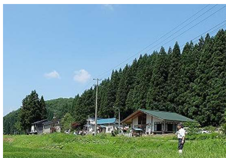
自然豊かな荒又集落