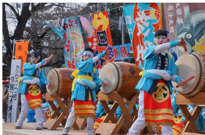
地域行事で披露される金浦(きんぽう)神楽