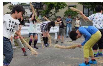
赤石の菖蒲よもぎ