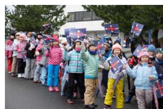
白瀬中尉をしのぶ雪中行進