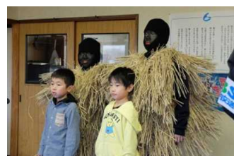
小正月のアマハゲ