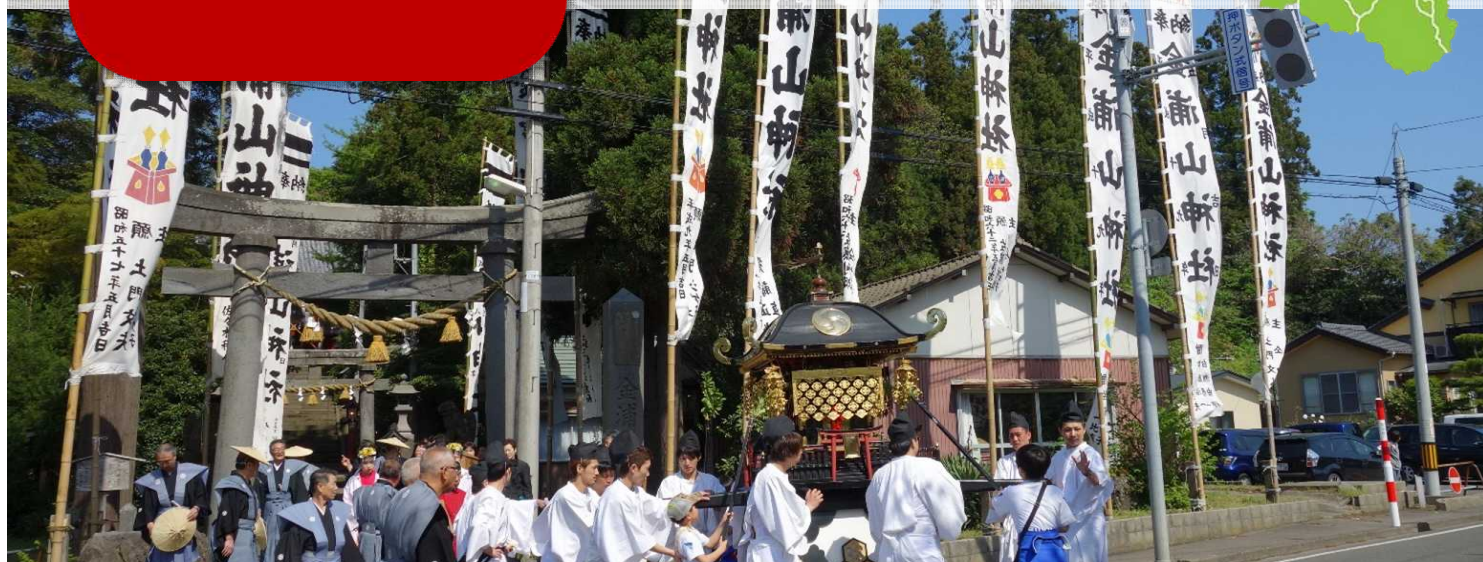
5月の金浦山神社例大祭の様子。神輿の練り歩きが行われる地域の一大行事。