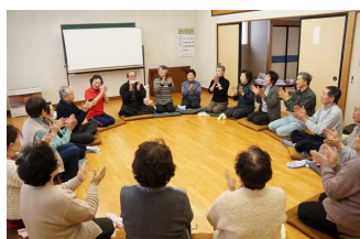
地区ごとの健康教室