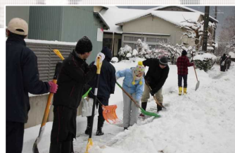
冬休み明けの一斉除雪