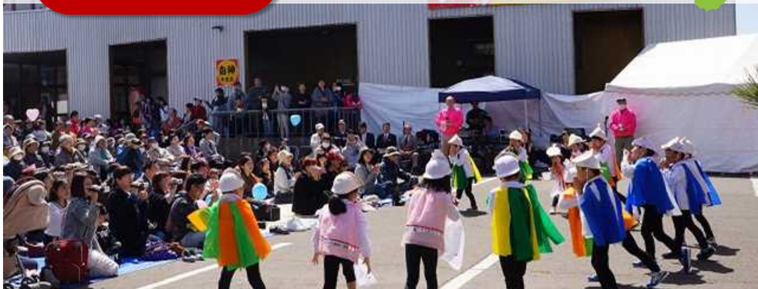
平成22(2010)年に始まった桜並木フェスティバル

臈淵(かいらげぶち)、道地(どうじ)、扇田(おうぎだ)、機織(はたおり)の旧小学校区(計24の町内会)で「東能代地域まちづくり協議会」を結成し、地域活動を行っています。