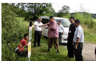
危険箇所の見守り

冬休み明けの通学路一斉除雪や、夏休み前の危険箇所の巡回のほか、地域の先輩たちを祝う「長寿の集い」を開催するなど、子供から高齢者まで、多くの世代と関わりを持って活動を行っています。