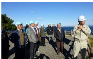
産業部会の企業見学