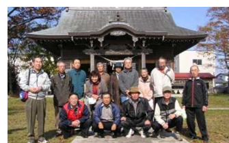
歴史部会の地域探訪