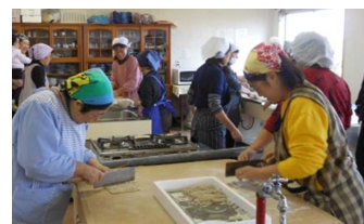
公民館の生涯学習活動