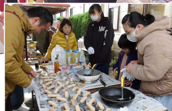
まち灯りの灯りづくり