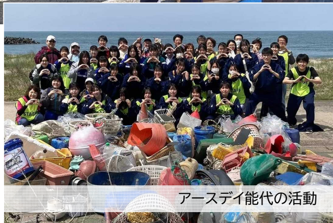
アースデイ能代の活動