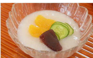
お茂ちゃんの料理教室