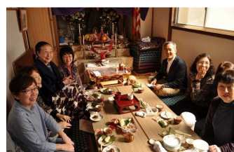
伝統の観音様の札打ち