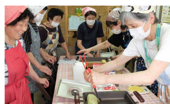
ときめき工房・ねま〜る