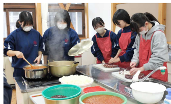
未利用魚の特産品づくり