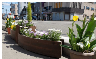
女性部の美化活動