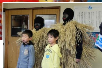
1月…赤石のアマハゲ