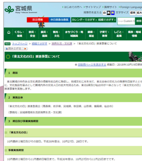
例：宮城県公式ウェブサイト

※「東北文化の日」として一体的に広報を行うことで、広域に効果的なPRができます。