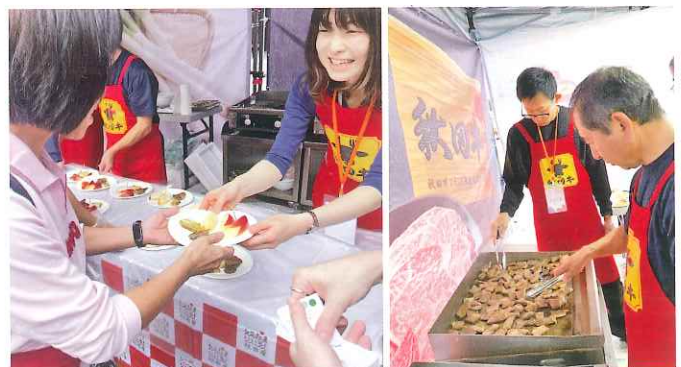
台北市内の信義シャンゼリゼ広場で秋田牛を試食提供

台湾でもタイと同様に高い評価を受けている秋田牛ですが、今後も観光と連携したPRに取り組み、認知度の向上を図ります。