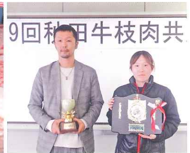
チャンピオン賞を獲得した枝肉と生産者の(農)大進農場