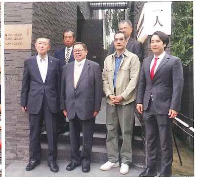
秋田牛を提供する飲食店での記念撮影