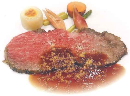
会場で振る舞われた秋田牛のコース料理