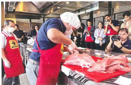
カット技術講習会

秋田牛はタイで高い評価を受けており、今後も現地の関係者との連携強化を図りながら、更なる輸出拡大に取り組んでいきます。