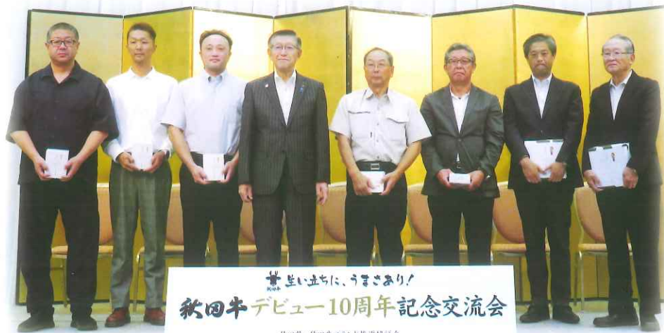
秋田牛デビュー10周年記念交流会