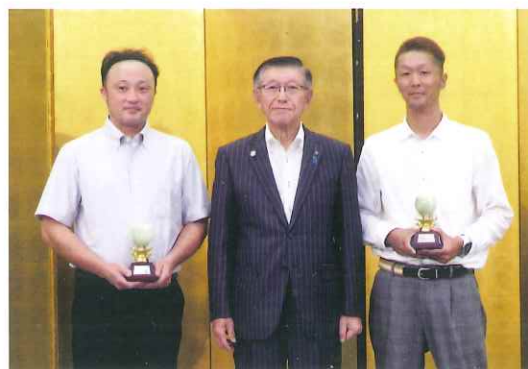
第18回秋田牛枝肉共励会 褒賞授与後の記念撮影 左：(株)寿牧場 右：(農)大進農場