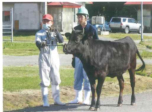
練習牛とともに調教技術に磨きをかけています

各種共進会への出品に向けて、県畜産試験場で大農畜産部の皆さん参加の定期的な調教勉強会が開かれています。勉強会では、牛に見立てたパネルを用いたロープワークの実習のほか、昨年度導入した練習牛2頭を実際に調教し、歩く、止まる、方向転換などの基本動作の習得に励んでいます。練習を重ねるにつれ少しずつ牛と心を通わせ、指示どおりに動かせるようになりました。今後も定期的な勉強会を通じて、技術に磨きをかけていきます。