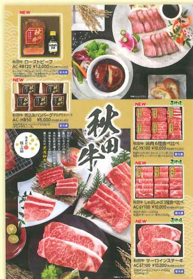
プリマハム(株)のギフトカタログ

今年の冬は、日頃お世話になっている方へのお歳暮として、毎日頑張っている自分へのご褒美として、是非、プリマハムギフトの秋田牛シリーズをご利用ください！