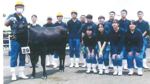
共進会初出品! 出品牛とともに記念撮影

結果は2頭とも1等賞を獲得! 8月25日に行われる秋田県和牛改良共進会にも出品することとなりました。