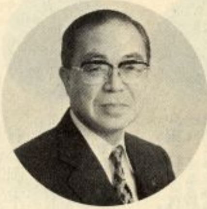
知事 佐々木喜久治 61 (無所属・現②)