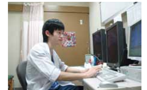
当直(救急外来)にて