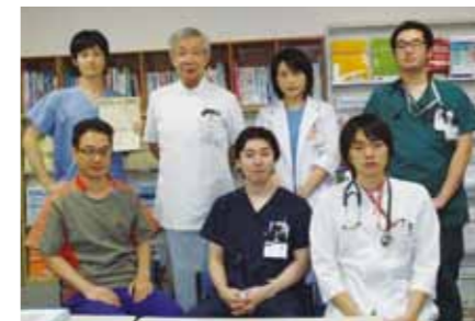
研修医委員会にて