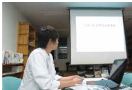
症例発表(抄読会)にて

初期研修終了後、希望する専門分野においてより高度な知識・技術の修得を目的に後期臨床研修が可能です。