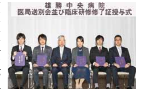
臨床研修終了証授与式 (2017.3)