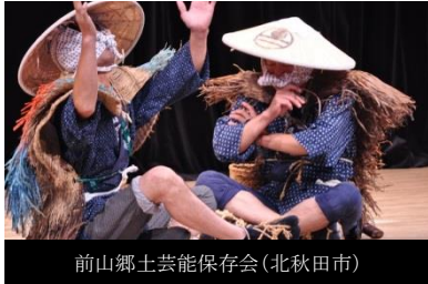
前山郷土芸能保存会(北秋田市)