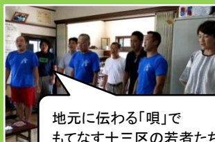
地元で伝わる「唄」で もてなす十三区の若者たち