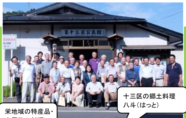
十三区の郷土料理 八斗(はっとう)

これまでも県内集落の交流を元気ムラ通信でご紹介してきましたが、9~11月にかけて、県外の集落との交流が活発に行われました。右の写真は9月7日(日)、横手市・栄(さかえ)地域の皆さんが岩手県平泉町・十三区を訪れて交流した時の様子です。「後三年合戦」や平安時代の古道「東山道」の歴史資源を持つ栄地域は、これらの歴史と深い関わりを持つ平泉町と今後も交流を続けたいと考えています。お互いの郷土料理を持ち寄り、賑やかな交流会となりました。