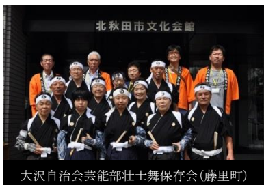
北秋田市文化会館