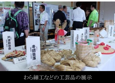
わら細工などの工芸品の展示