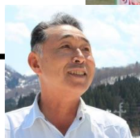
前列・左から2人目