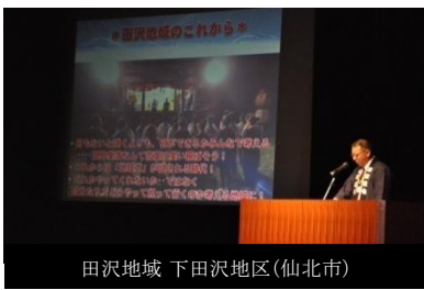
田沢地域 下田沢地区(仙北市)