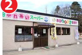
赤田ふれあいスーパー (由利本荘市)