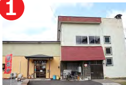
みせっこあさみない (五城目町)