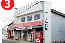
仙道てんぼ (羽後町)