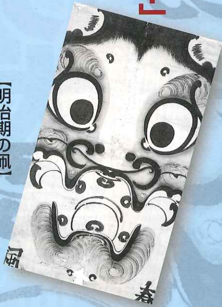
高倉案蔵 作「まなぐ凧」