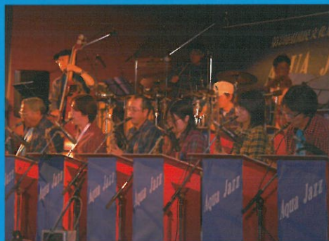
美郷ジャズオーケストラ (秋田県)