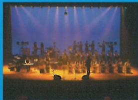
茨城県水戸工業高等学校 ジャズバンド部 (茨城県)