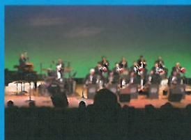
ニュービートジャズ オーケストラ (青森県)