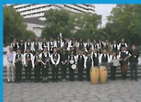
名古屋小中学生ビッグバンド (愛知県)