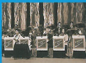
T・オアシス an オーケストラ (島根県)