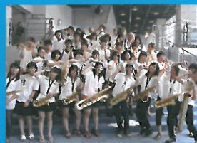
名古屋高校生ビッグバンド (愛知県)