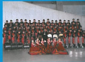
美郷町立美郷中学校吹奏楽部 (秋田県)