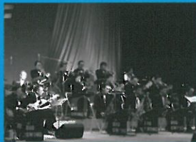
BIG SWING FACE (山形県)