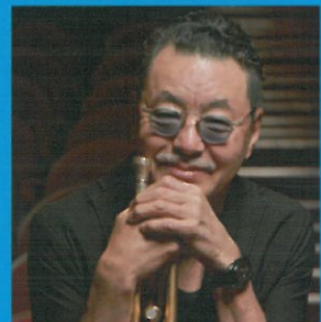
日野 皓正 さん (トランペット)

日野さんは、平成元年に日本人として初めてジャズの名門レーベル「ブルーノート」と契約、現在も日本を代表する国際的アーティストとして世界各国で活躍しています。唯一無二のオリジナリティと芸術性の高さを誇るヒノテル・サウンドをこの機会にぜひお楽しみください。