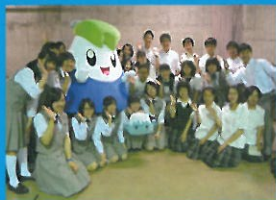
富士学苑中学校高等学校ジャズ バンド部 (山梨県)