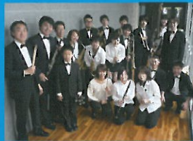
由利吹奏楽団パイ・トータル オーケストラ (秋田県)