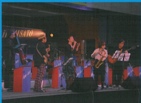
KAMATA 2014 (東京都)