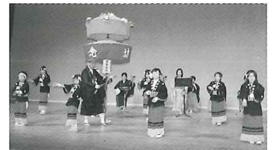
願念坊踊 (富山県小矢部市)