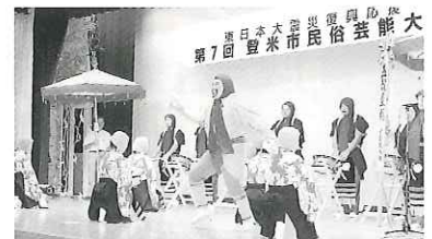
小島願人踊 (宮城県登米市)