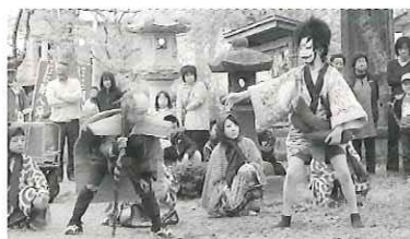
子ども願人踊 (秋田県八郎潟町)