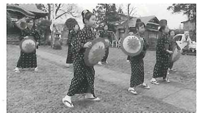
今戸子ども民謡手踊り (秋田県井川町)

※2日目の10月26日(日)は、八郎潟町町民体育館で公演後、一日市商店街を練り歩きます。その後、八郎潟町防災多目的広場で再び公演します。出演団体や出演時間等は、変更になる場合があります。