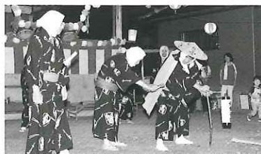
駒衣の伊勢音頭 (埼玉県美里町)