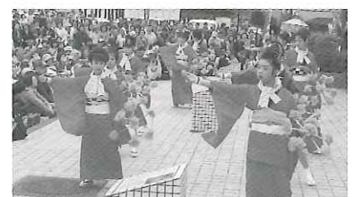
秋田音頭 (秋田県八郎潟町)