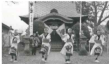
今戸子ども願人踊り (秋田県井川町)