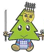
秋田県マスコット スギッチ