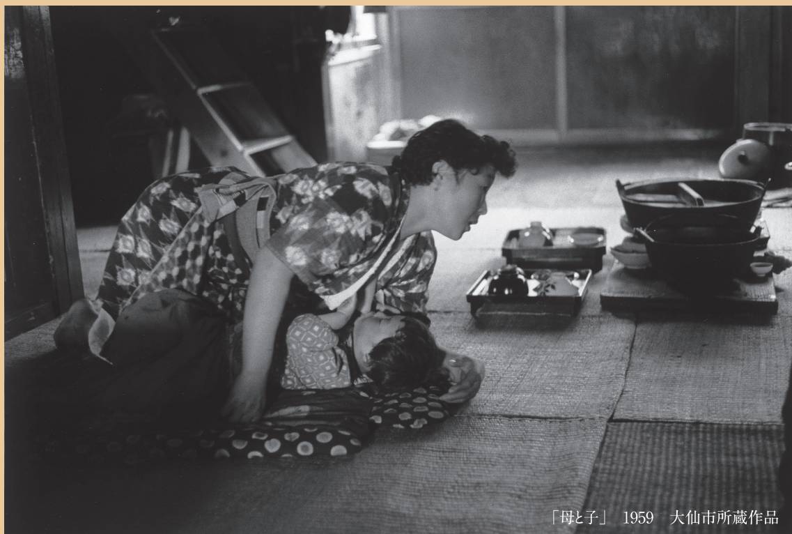
「母と子」 1959 大仙市所蔵作品