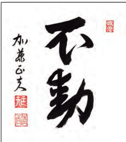
題字 故 加藤 正夫 氏

故加藤正夫名誉王座の日本棋院理事長就任と同時期に歩み始めた大仙市の子ども囲碁普及事業。加藤氏没後10年の節目に、加藤氏の遺志を受け継いで、現在、囲碁普及現場の最前線で活躍されている棋士の皆さんと共に全国のこれまでの青少年囲碁普及活動を振り返ります。